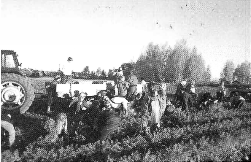
Ivriga miljöentusiaster från Sollerö skola sysselsatta med morotsskörd i Kulåra.

Många förändringar har skett på skolan både inomhus och utomhus de senaste åren. Vi har sedan hösten 1996 ett miljöråd, som består av klassrepresentanter och en personalrepresentant. Det sammanträder regelbundet och kommer med många bra idéer, och visar ett stort engagemang. Barnen har varit med och drivit igenom många av de förändringar som skett på skolan. De sköter och tömmer källsorteringsstationen. Miljörådet har idag en egen anslagstavla på Konsum där bl.a. deras protokoll finns anslaget. Vi har inga pappershanddukar, utan 6-års gruppen är handdukspatrull och byter och tvättar handdukar. Alla barn plockar varje höst några liter bär, som det kokas sylt av i skolköket. Att få äta äkta drottningssylt till pannkakan i skolan är inte dumt! Runt skolan har vi planterat fruktträd och bärbuskar. Dagens har ett eget växthus. Barnen hjälper till att städa klassrummen, källsorteringen sker redan i klassrummet. Vi har maskkomposter inomhus, som barnen sköter. Vi har ett arboretum (trädplantering) på skolgården där de flesta av ortens träd finns representerade. Där finns också en raritet, nämligen flik-alen, (Se Sool-Öen 1996 sid 39). Varje år har vi grodväkeri vid Agnmyren. Barnen har sytt västar med grodor på i slöjden, som de med glädje sätter på sig vid grodspelet. Vaktlistor görs upp och myren och grodorna vaktas hela dagen lång. Till och med TV har uppmärksammat händelsen och filmat våra duktiga grodväktare.