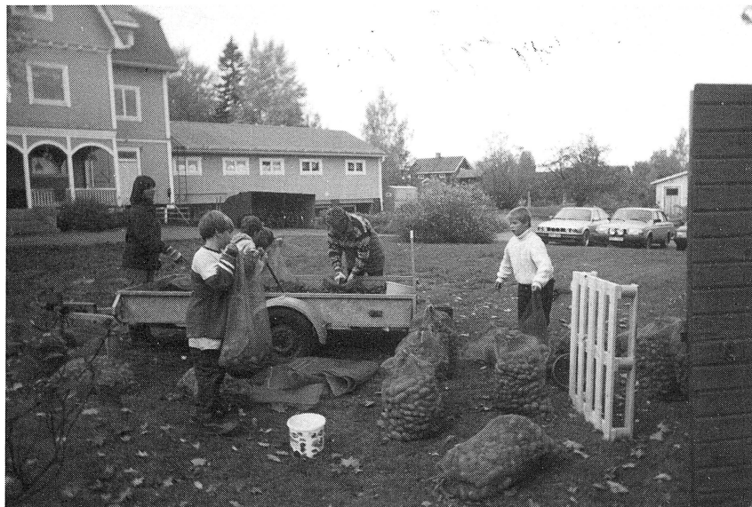
Skörden packas i säckar inför vinterns skolmåltider. Konsumfastigheten i bakgrunden.

kornet i stenar istället för valsar, så blir flera näringsämnen kvar i mjölet. Man känner beundran för forna tiders kunskap. Det är också miljöfostran att känna till miljöhistoriska aspekter. Varje år har vi också en Sollerödag i skolan. Då studerar vi både vårt arv från forna tider och aktuella händelser på ön.