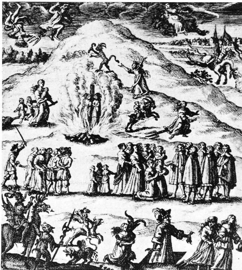
Gammelt tyskt kopparstick (okänd mästare) föreställande häxbränning i Mora 1670, dock felaktigt visande den kontinentala avrättningen där häxorna brändes levande på bål.