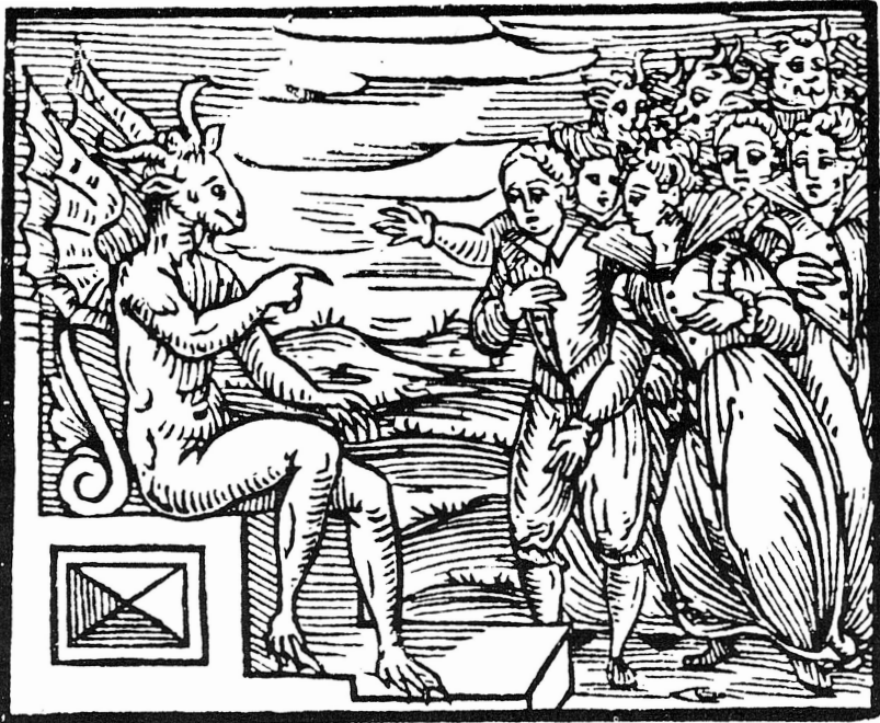
Den medeltida uppfattningen om djävulen och hans makt över människorna spelade en stor roll i häxprocesserna. Illustration efter träsnitt av munken Francesco Maria Guazzo i «Compendium Maleficarum.»