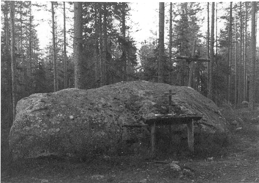
Mali-Bambo 1998 med det primitiva altaret och korsen. Framför stenen finns enkla bänkar och vid ena sidan en predikstol som tillverkats av en grov trädstam.