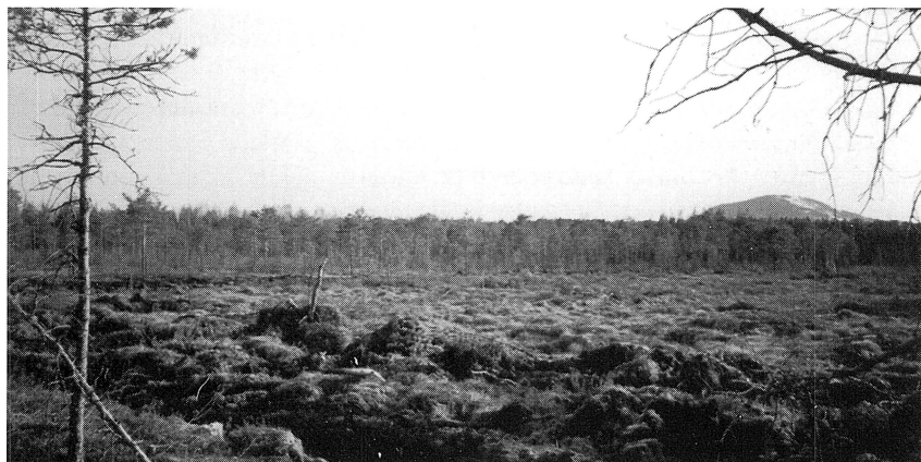
Hål 15 - "före".

ägare till en fritidsfastighet vid Siljan (dock ej direkt berörd av planen). Vi hade enligt påstående rensat diken i för stor omfattning. Det hela kunde dock redas ut och i slutet av mars fick vi byggnadslov för de förberedande schaktningsarbetena och tillstånd till dikning enl. fastställd karta. Men vi tappade en månad då myren var lättillgänglig.