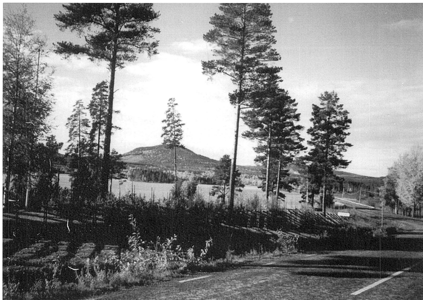
Vy från 1:a Tee.