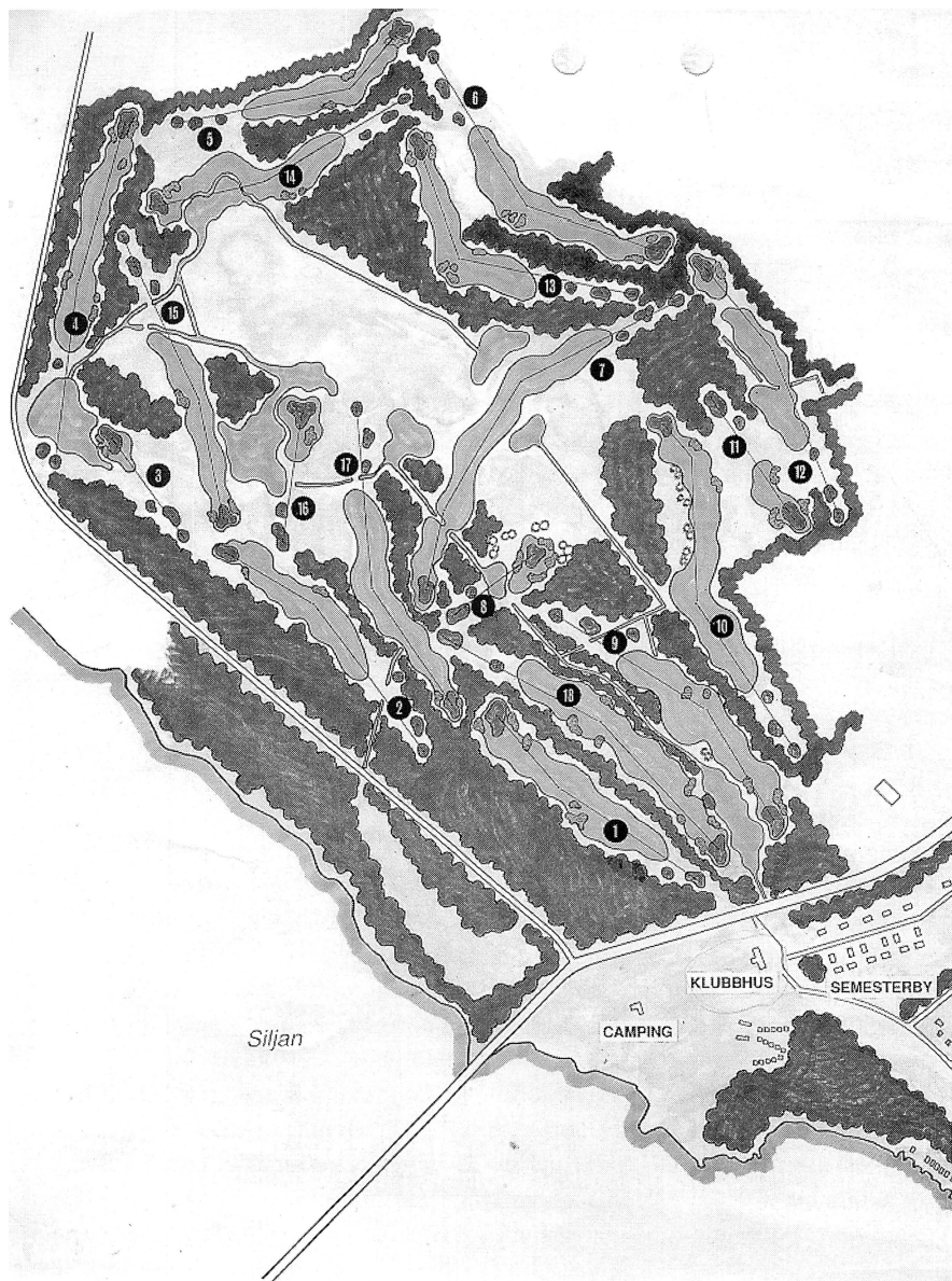
Den byggda 18-hålsbanan