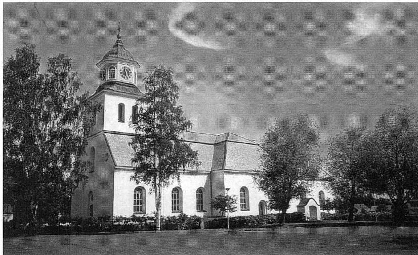
Sollerö kyrka – vår vackra helgedom "mitt i byn".