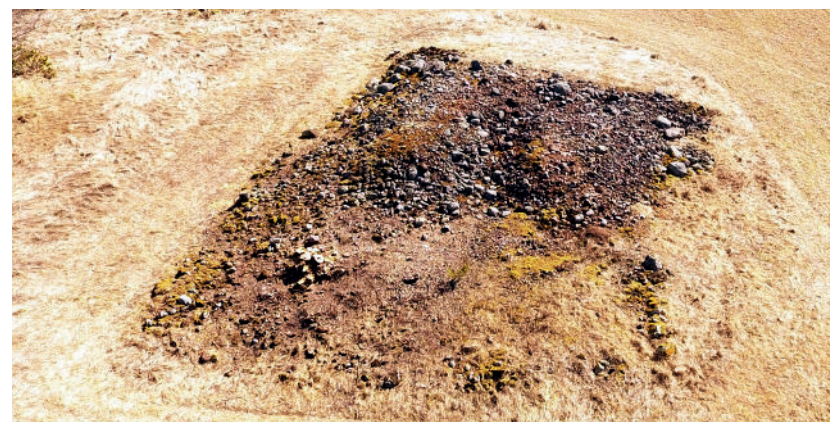
Fig 1. Hargen fotograferad från nordväst.

I västra kanten av Bengtsarvets gravfält på Sollerön ligger en märklig kvadratisk stenkonstruktion som skulle kunna vara en harg, en plats för rituella aktiviteter under vikingatiden (fig. 1). Den är 20 x 23 meter stor och 1,75 meter hög med en jämn översida, närmast som en plattform. Två stenarmar leder ut från anläggningens nordvästra del. Mellan stenarmarna är marken gräsbeväxt och bildar en nedre plan yta som sannolikt också är uppbyggd av sten men som i dagsläget är för överväxt för att bedöma hur den ursprungligen sett ut. Ytan kan