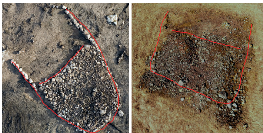
Fig. 7. Jämförelse mellan hargen i Lilla Ullevi (vänster) och den i Bengtsarvet (höger). Stenkonstruktionernas ramverk har markerats med röd linje. Konstruktionens topografiska läge på kanten av en förkastningsbrant (Klikten) på Sollerön har medfört att stenmaterial rasat ut varför strukturen framträder mindre tydligt än i det flacka landskap där hargen i Lilla Ullevi återfinns.

I den östra delen av stenkonstruktionen i Lilla Ullevi fanns två enkla strängar av sten vilka sträckte sig vidare österut dryg sex meter upp mot berget. Övergången mellan stenlagd och icke stenlagd del var belägen där topografin planade ut vilket innebar att den stenlagda delen var relativt horisontal. Även stenkonstruktionen i Bengtsarvet har två utskjutande stenarmar, i detta fall mot västnordväst. Dessa är