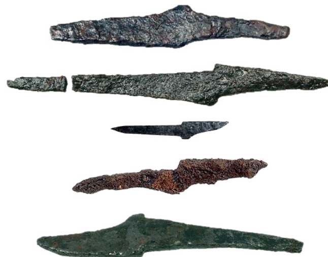
Fig. 6. Överst två knivamuletter från kultplatsen intill Frösthults kyrka i västra Uppland som undersöktes 2016. Den övre är 93 mm och den nedre 113 mm lång (Evanni, Hamilton & Hållans Stenholm i manus). Foto: Acta konservering. Därunder den närmast identiska knivamulett från hargen i Bengtsarvet. Foto: Acta konservering. Amulett från Bengtsarvet är något mindre (85 mm) än amuletterna från Frösthult. Andra nedifrån är en av fyra knivamuletter från ett vikingatida gravfält i Vedby, Badelunda socken i Västmanland. Kniven är 75 mm lång. Foto: Stiftelsen Föremålsvård. Längst ner en knivamulett av samma typ från Svarta Jorden i Birka, längd 80 mm. Foto: SHM.

fysiska lämningar som indikerar att platsen betraktades som helgad och föremålsfynd som kan bedömas vara kultrekvisita (t.ex. eldstålsformade amuletter, torshammare, miniatyrer, kittlar och ringar). Andra arkeologiska belegg för kultutövning är depositioner, dvs. nedgrävda föremål och djur eller människor som offerats.