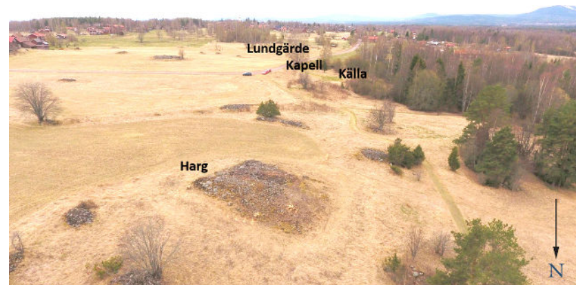
Fig. 2. Kultplatsmiljön på Sollerön. Uppe i högra hörnet skymtar Gesundaberget.

Den rektangulära stenkonstruktionen har vi tolkat som en harg. Ordet kunde beteckna en klippa, markerad berghäll, stensamling eller liknande och fungerade som kultplats. Arkeologiskt undersökta konstruktioner vilka bedömts som harg har utgjort både helt naturliga stenformationer och uppbyggda stenkonstruktioner. Hargen ingick, tillsammans med andra platser med andra rituella funktioner, i en större kultplatsmiljö. Namnet Lundgärde direkt åt sydost visar ungefär var Solleröns heliga lund var belägen. I Adams av Bremen skridningar av bloten i Gamla Uppsala berättas att varje träd i lunden ansågs äga gudomlig kraft och att offerade människor och djur hängdes upp i träden. Det finns ingen anledning att ifrågasätta Adams berättelse (i stort) och både samtida avbildningar på bildstenar och arkeologiska undersökningar (t.ex. på Frösön i Jämtland) påvisar samma offerförfarande. Vid kapellplatsen, inte långt från Lundgärdet, finns en källa. Just källor är ett återkommande naturelement på platser med kultindikerande ortnamn. Källkulten har en lång kontinuitet,