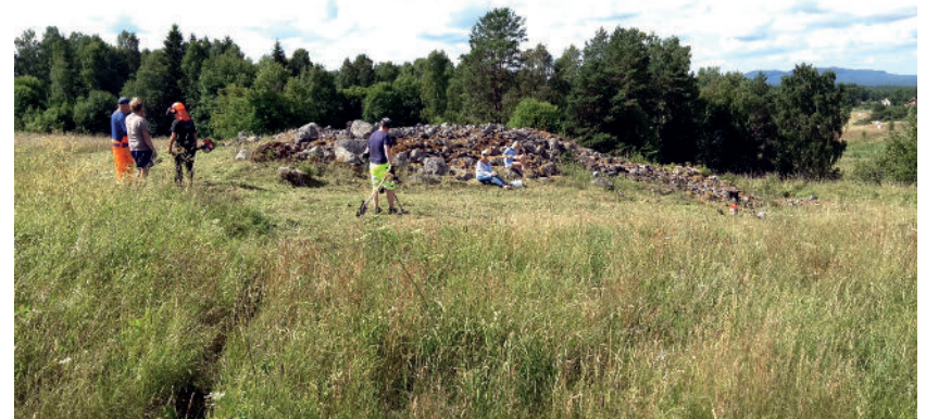
Fig. 4. Området runt hagen röjdes inför detekteringen av hembygdsföreningens vikingagrupp. Detekteringen utfördes av Magnus Lindberg (i gula byxor) från Arkeologerna/SHM.

För att om möjligt stärka teorin om en harg i Bengtsarvet genomfördes en undersökning i form av metalldetektering i närområdet kring stenkonstruktionen. Förhoppningen var att fyndmaterialet