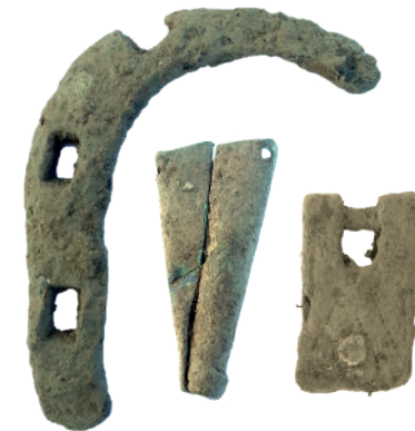
Fig. 5. Exempel på de föremål som påträffades vid detekteringen av närområdet runt hagen. Till vänster en hästsko av tidigmodern typ, i mitten en doppsko med hål för infästning i skaftet. Funktion och datering är osäker men möjligen härrör doppskon från en parasoll och kanske är spåren efter en picnic på 1800-talet. Till höger ett rembeslag med en kvarsittande nit för läderremmen. Observera det ristade mönstret. Beslaget kan tänkas härröra från en hästutrustning, kanske en häst som jobbat i jordbruket. Föremålen är inte skalenliga.

skulle ge en fingervisning om anläggningens funktion. Matjordslagret inom en yta på ca 625 m 2 genomsöktes. Som är vanligt i åkermark som brukats under lång tid gav detekteringen utslag på ett stort antal metallföremål. Många av dessa undersöktes inte då de av detekteraren