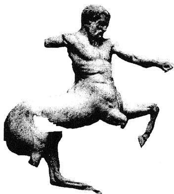
Centaur; Parthenon Athen

Det grekiska sagodjuret centaur , hälften häst och hälften människa, kan ha uppstått ur det intryck kretensare och andra urinvånare i Europa fick då de för första gången såg hästar och beridet rytteri. Den grekiska mytologin lånade sedan in detta sagodjur och det beskrivs verkligen som en erövrare. Centaurerna var nämligen våldsamma slagskämpar, begivna på vin och rövade bort de kvinnor de kom åt. Dessutom gömde de sig i skogarna där de åt rått kött och gruffade sins emellan. En förfadersbeskrivning att vara stolt över. - Eller hur?