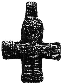
Den äldsta Kristusbilden i Sverige från 900-talets Birka. Halssmycke 3,4 cm högt funnet i en kvinnograv

Därför kan man med rätta säga att kristendomen firar tusenårsjubileum i Sverige. Det var först omkring år 1000 missionsförsöken återupptogs. Denna gång från två håll, Hamburg-Bremen och England. Till en början dominerade den engelska missionen. Vikingarna hade haft goda kontakter