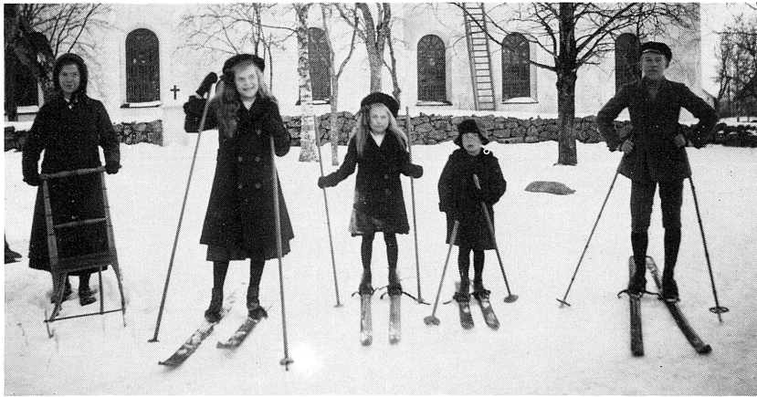
Karl Lärka har här fotograferat en grupp okända ungdomar på skolgårdstomten norr om kyrkan. Skidutrustningen tidsenligt för 20-talet.