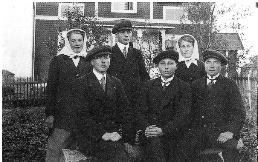
Vem kan hjälpa oss med namnen? 1914 eller -14