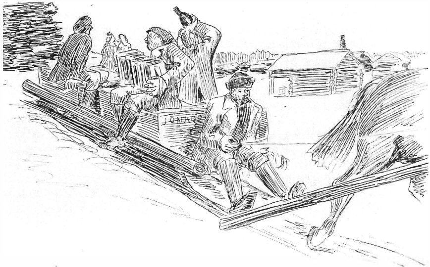
Hemfärd från en vinters skogsarbete