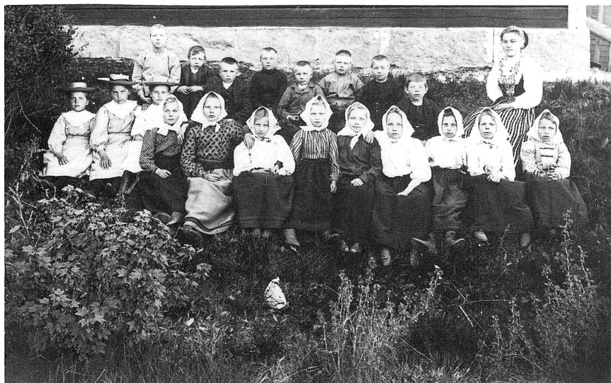
Från Ryssa skola