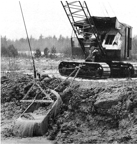
Vid grävningen av det stora invallningsdiket användes en s.k. gräv- och slängskopa.

och engagerade sig i många saker, en del tyckte nog att han lade sig i allt för mycket. I varje fall är det en riktig skatt som här finns bevarad. Han var med på detta sammanträde och skrev om det i sin "Kladdbok". Intressant är att en person blir direkt utpekad som den verkliga idégivaren till invallningen: