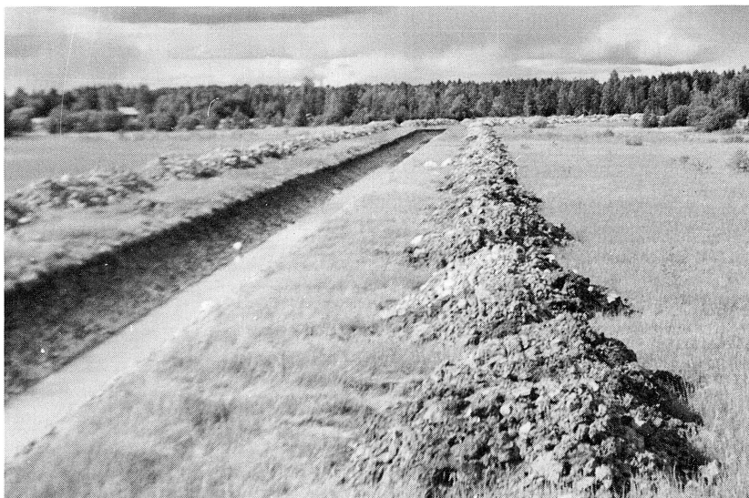
Det stora invallningsdiket första sommaren. Prydligt ligger de upprädda högarna på båda sidorna. Jämför bilden med den sista i denna artikel.