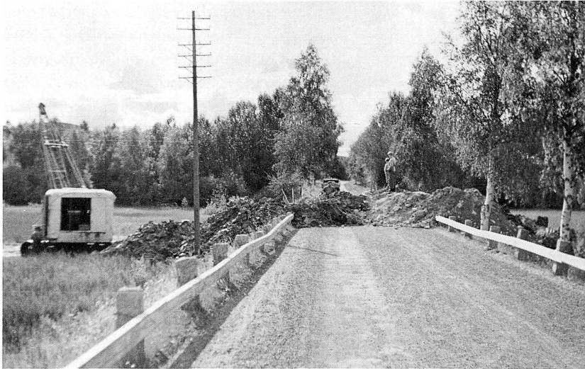
Grävmaskiner har tagit upp invallningsdiket genom landsvägen.

na att tro på lantbrukets betydelse för en sund tillvaro. Också författaren Erik Axel Karlfeldt var inne på samma linje. I en dikt, "Till en jordförvärvare," skriver han