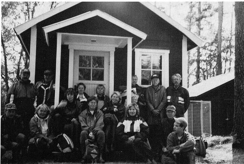
Hushållningsgillet's utflykt till utskogen sommaren 1997. Deltagarna samlade framför Korsnäsbolagets stuga vid Görsjön.

Man har i dag kanske svårt att helt förstå omfattningen av fåbodväsendet. Omkring 1880 torde hela Solleröskogens betesmöjligheter varit maximalt utnyttjade.