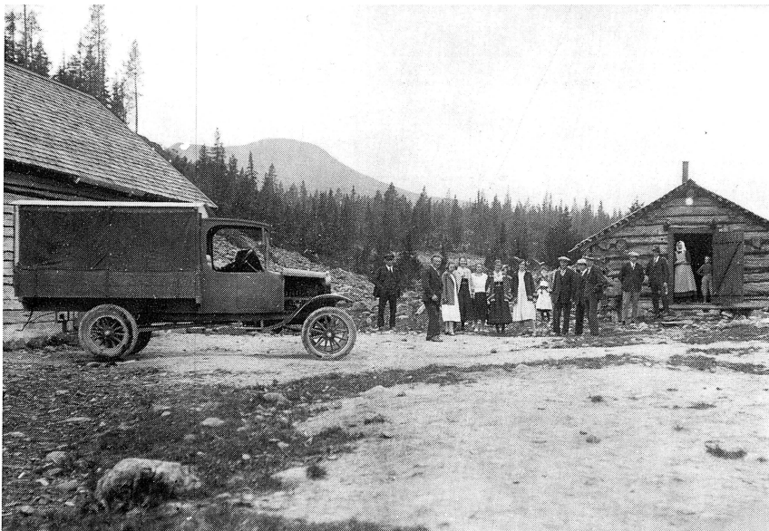
En utflykt på 1920 - 30talet