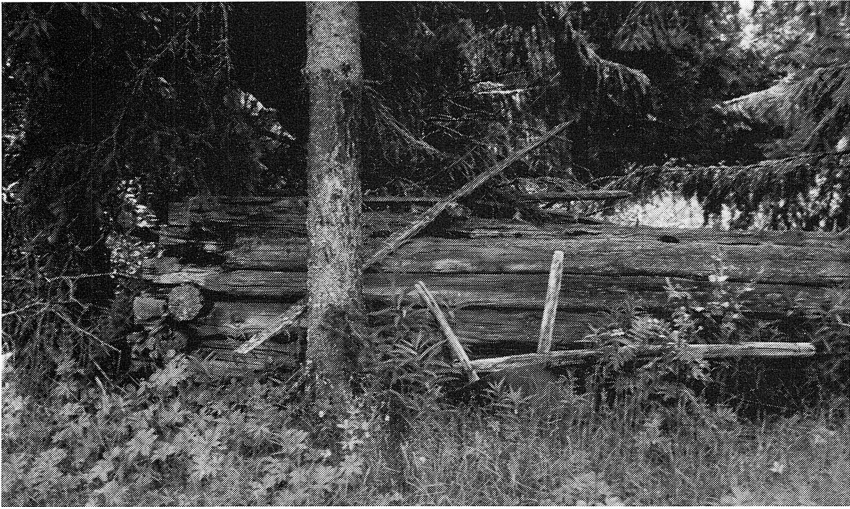
En typisk bild av en gammal fäbod i dag. Granen har vandrat in och tagit över fäbodvallen, ett nedruttet fähus och en kvarglömd plog.

Den inhägnade täkten delades genom en i ost-västlig riktning gående gata i två halvor. På den nedre täkten fanns på 1880-talet Lavasstugan, ägd av sex familjer samt två fähus. Inom övre täkten, som vetter mot söder låg i rad ett stycke från gatan tre stugor, Nisstugan, Bosstugan, och Dunderstugan, var och en ägd av tre- fyra familjer. Tre fähus omgivna av långa kyor (uppsamlingsfällor) låg utmed hägnaden, gärdesgården. Vardera täkten hade ett för alla familjerna gemensamt härbre. Dessutom fanns några lador ägda av en familj eller flera i lag. De flesta fäboddelägarna kom från Gesunda åkerfäbod. Man hade rättighet att ha obegränsat antal egna kreatur här. Täkten var skiftad i tjägar. Råstenarna (spetsformade stenar) till dessa kan ses än i dag.