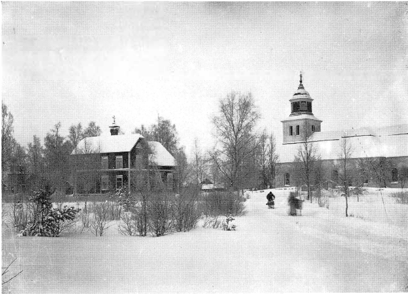
Sollerö kyrka och ordenshuset omkr. år 1915.