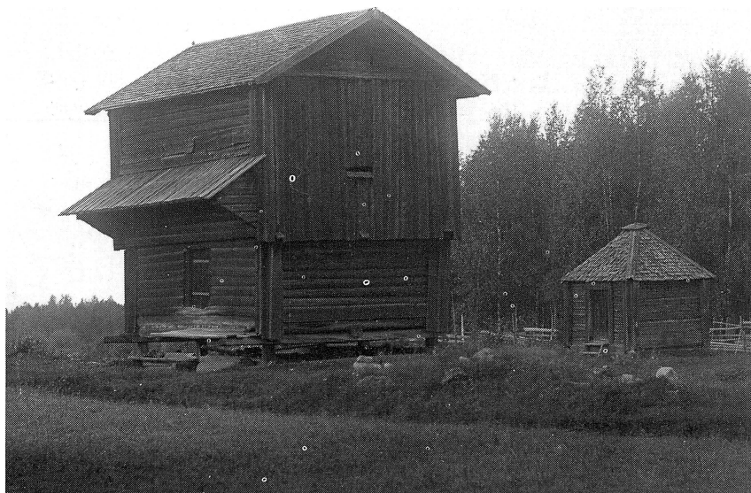
Militärboställets härbre och hemlighus. Det senare revs på 1940-talet.