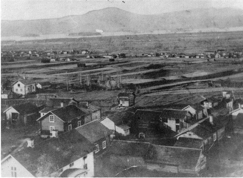
Utsikt från kyrktornet mot Gesundaberget år 1894. I förgrunden det ännu ej tornförsedda Melinshuset. Bortom syns Hagmansgard och den kringbyggda Lövgard. Längre bort till vänster det nybyggda bostadshuset vid Hällgard.

Dessutom finns det ett speciellt område som kallas Haraldsarvet, nämligen området kring det s k Kaptensbostället (numera Vibergsgard), byns östra utpost.