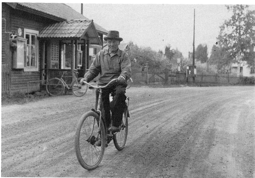
Vem är cyklisten som just passerat "Linkis"? Är det Påls Niss?

lag är ett senare begrepp för samma sak och det omfattar alltså inte hela bygden eller socknen utan bara en by. Bondelag är en skatteenhet med medeltida anor och som för Solleröns del upphörde år 1604. Rotesystemet, som var ett sätt att organisera utskrivningen till och försörjningen av försvaret, infördes tidigt i Dalarna. År 1621 började det fungera på Sollerön och antalet rotar var då 22. Från början var de, liksom bondelagen, inte strikt geografiskt avgränsade utan det viktigaste var att ge roterna en sådan sammansättning att de blev tillräckligt och ungefär lika starka ekonomiskt.