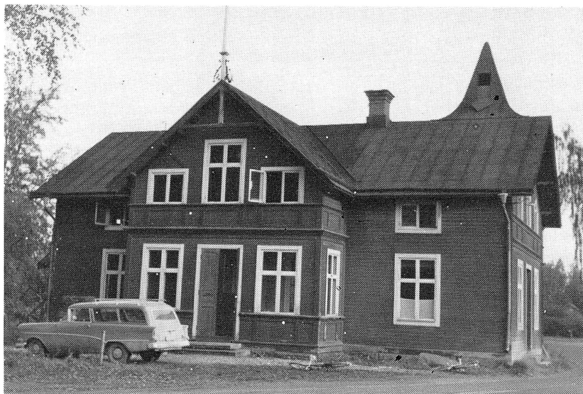
Melinshuset ska rivas! September 1962. Bond Karl har parkerat sin Opel Record Caravan utanför och går lös på husets inredning.

Häradsarvets kanske tusenåriga epok som jordbruksby verkar vara till ända. Avvecklingen har gått mycket snabbt de senaste åren. En titt på kartan från år 1987 visar att det inte finns särskilt mycket obebyggt mark kvar i byn. Det framtida jordbruket i Häradsarvet får nog inriktas på trädgårdsskötsel i liten skala. Byns karaktär har definitivt ändrats. Nu är Häradsarvet servicecentrum och ”sovstad”.