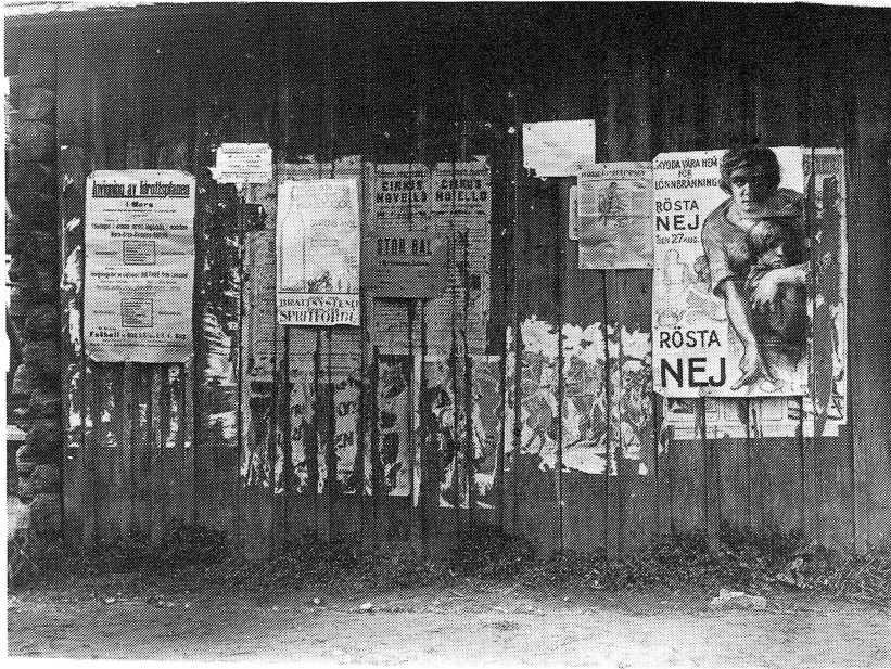
Trintlad 1922. Solleröns affischställe nummer ett. Man kan bl a läsa att idrottsplatsen i Mora invigs den 12 augusti. På Nya Dansbanan, Sollerön, blir det stor bal. Omröstningen om spritförbudet var aktuell: Bort med Brattssystemet, rösta ja. Skydda våra barn för lönnbränneri, rösta nej! Skommar Anders Andersson utförde reparationer av alla slag. Obs! Billiga priser.