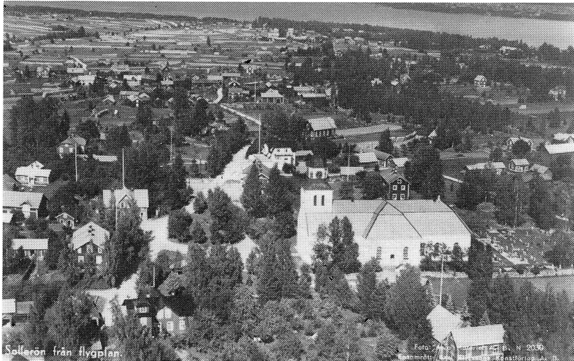
Häradsarvet från ovan. En husgavel skymtar mellan kyrkan och det nu rivna Ordenshuset. Det är sockenstugan som är på väg från Koopen till nya platsen öster om Ordenshuset. Året är då 1940.

Att Småstad är byggt på Delgårde och nedre delen av Sinarvet, det vet kanske en del. Gatukittan bör varje allmänbildad solleröbo känna till — den ligger där vägarna mot Bengtsarvet och Utanmyra skiljs.