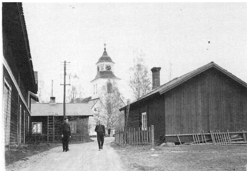
Före Sundsvägens tid, 1956. Till vänster Bolagsgårdens uthus och gamla posten nedanför Njuttbudi. Till höger Böl Jons gård.

länsstyrelsen söka fastställelse för hastighetsbegränsning till 20 km/tim för motorfordon å byns vägar. Resultatet framgår inte av senare protokoll. En seg fråga som behandlades vid många sammanträden var branddammarnas placering och finansiering.