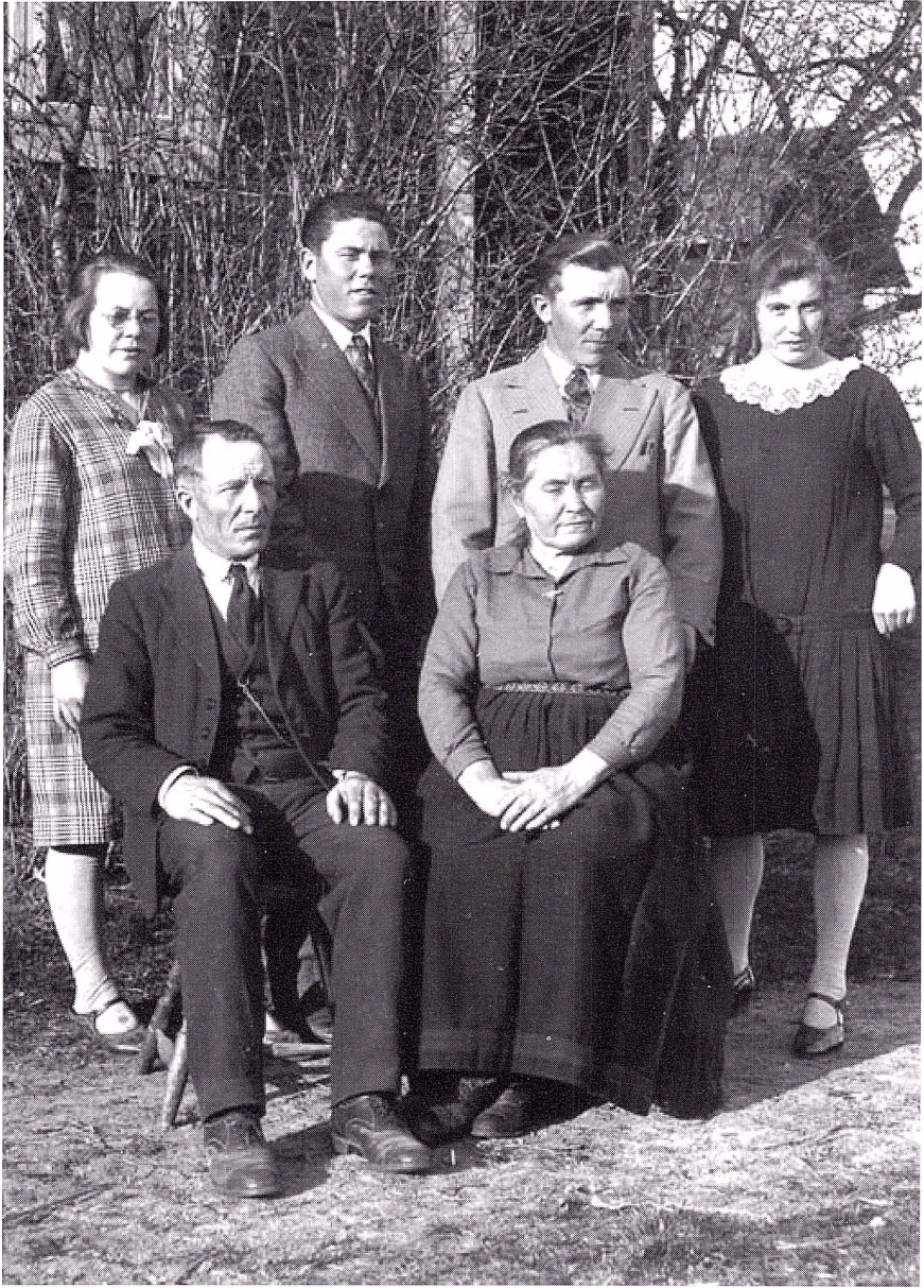
Hela familjen samlad för fotografering.