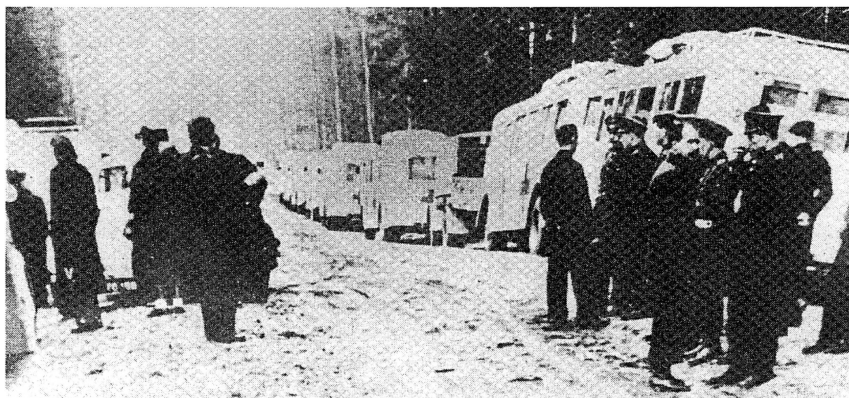
En konvoj av de vita bussarna under en paus på den tyska landsbygden när lägerfångarna rastades. Till höger står de Gestapomän som fanns utplacerade i varje buss och övervakade transporterna.

Under de följande veckorna skedde transporter från många koncentrationsläger i Tyskland till ett slags uppsamlingsställe i Neuengamme, söder om Hamburg. Bl.a. transporterades 700 fångar från Dachau, Malhow och Schönberg, Ravensbruck och några andra mindre kända läger. Vidare 1600 från läger nordväst om Dresden och 450 från Theresienstadt. Det sistnämnda lägret lär ha sett mycket välordnat ut. Det hade fungerat som ett slags mönsterläger som nazisterna visade upp för utomstående. Folke Bernadotte inspekterade bataljonen vid några tillfällen. Från Sachsenhausen i provinsen Oranienburg norr om Berlin transporterades 2200 danskar och normmän. Kontrollen var rigorös och i varje buss medföljde minst en Gestapoman. De flesta chaufförer hade svårt att förlika sig med dem eftersom de kunde bevittna den brutalitet som fångarna behandlades med. Det förekom hugg och slag med gevärskolvar och det hände att fångar inte reste sig efter denna behandling. De flesta av fångarna var ytterst utmärglade och det hände att det förekom dödsfall under transporterna. De döda måste bli kvar i bussarna eftersom de skulle räknas av vid slutstationerna. Totalt transporterades 22000 fångar till friheten men det finns uppgifter om att det varit betydligt flera, inte bara danskar och normmän utan även belgare, polacker, fransmän och holländare och även några andra nationaliteter.