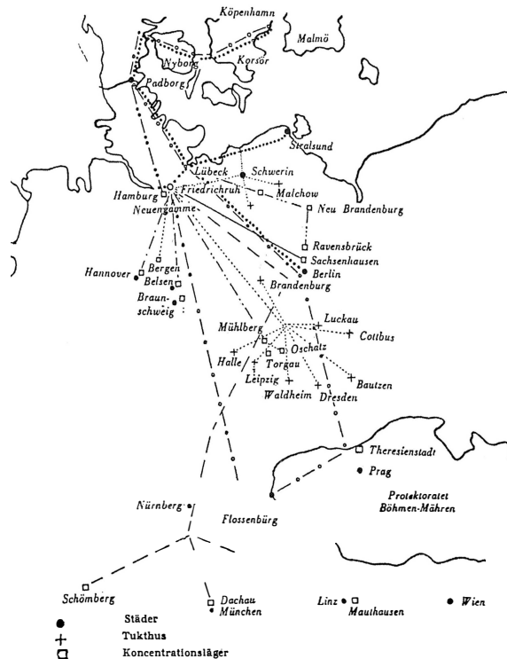
Skiss över "De vita bussarnas" transporter i Tyskland våren 1945. Bussarna var förlagda i Friedrichsruh utanför Hamburg och transporter skedde huvudsakligen i Nordtyskland men även från Dachau utanför München.