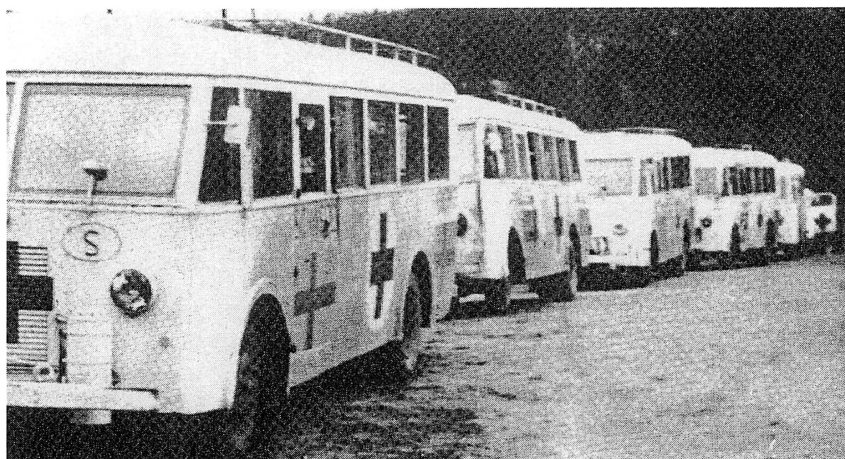
En kolonn av bussar på väg mot Tyskland. Bussarna var vitmålade och försedda med Röda Korsemblem och svenska flaggor på sidor och tak.

trupperna. Så småningom gick denne med på att Svenska Röda Korset med egna transport- och drivmedel skulle sammanföra skandinaverna i Neuengamme nära Hamburg för vidare transport till Danmark och Norge. Himmler hade förmodligen vid denna tid insett att slutet på andra världskriget var nära förestående och var kanske därför mera medgörlig.