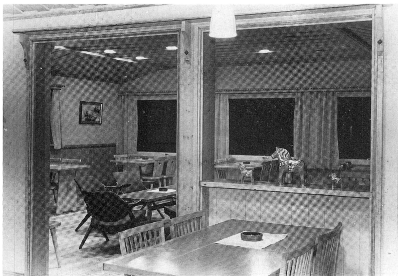
Här har mången kopp varm choklad serverats.