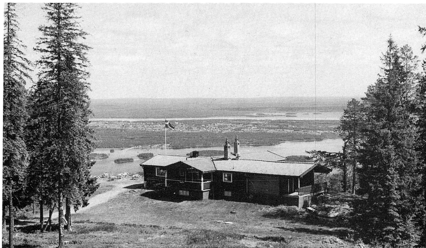
En vy man aldrig kan få nog av