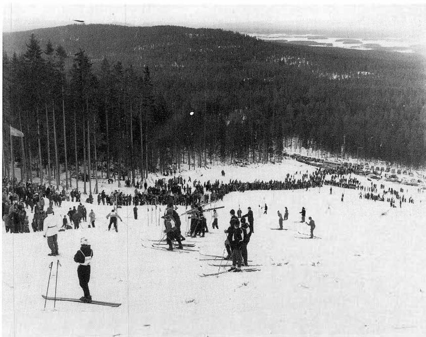
Den första tävlingen i Gesundabacken.

Gesunda- Ryssa- och Solleröbor hade nästan gått man ur huse för att med hjälp av sågar, yxor, spett och dynamit förverkliga en dröm. Skolbarnen fick ledigt för att dra ris. Det kokades kaffe och breddes mängder av smörgåsar. Efter många, många timmars hårt arbete var det klart och den 2 februari 1958 hölls den först tävlingen i Gesundabergets fantastiska slalombacke. Med sin fallhöjd och sin längd var den unik på dessa breddgrader. Åre stod närmast i jämförelse.