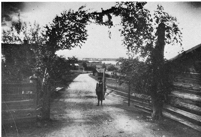
År 1917. Gesunda. Åkersgrind.

lösa över hela byn. Någon enstaka bil passerar, och rör upp vägdammet i ett väldigt moln. Vägen är livligt trafikerad sommartid. En tur runt Siljan var ett vanligt utflyktsmål även på den tiden, och då passerades ju även Gesunda på den rutten. Någon enstaka bilägare fanns förstås, men de var inte så många, fastän en bil inte kostade mera än ett par tusen kronor att köpa. Men mest var det ju s k herrskap som hade tid och råd med turistturer. Kvinnfolken i sina vida blomprydda hattar, och herrn i kostym och ”knall” eller motormössa och dito glasögon. Vi barn brukade roa oss med att kasta små hopbunda blombuketter upp i dessa förbiåkande nöjesfordon, vilka dels var öppna, dels inte körde fortare än att man hann väl med detta. Om lyckan var god kunde vi inkassera en 10- eller 25-öring för besväret. Men mest var det nog kopparslantar.