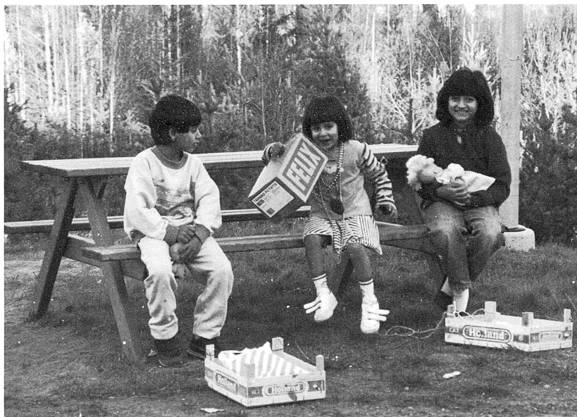
Lekande flyktingbarn.

90 % av de flyktingar som kom till Gesunda förra året väntar fortfarande på besked om de ska få stanna kvar i Sverige eller ej. Av övriga 10 % har en del utvisats bl a till Rumänien, Ungern och Tjeckoslovakien. En sjuntonårig flicka från Irak fick besked om utvisning och trots överklagande och protestlistor från flickans skolkamrater och lärare på Strandens skola i Mora fattade man ett nytt beslut om utvisning på tillståndsbyrå i Karlsund. Flickan är nu troligen gömd någonstans i Sverige, ett öde hon i så fall delar med 3 000 andra människor runt om i vårt land. Vi kan dock inte helt säkert veta om hon är utvisad eller ej, eftersom polisen inte har skyldighet att meddela flyktingförläggningen om de verkställer utvisningen efter det att flyktingen har avvikit från förläggningen.