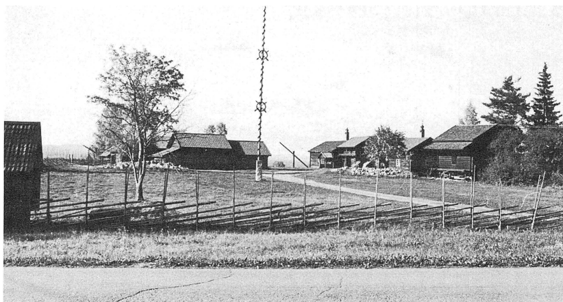
Sollerö hembygdsgård 1989.

1971 sattes en brunnsvåg (vindstång) upp för att markera brunnens plats i gårdsbilden.