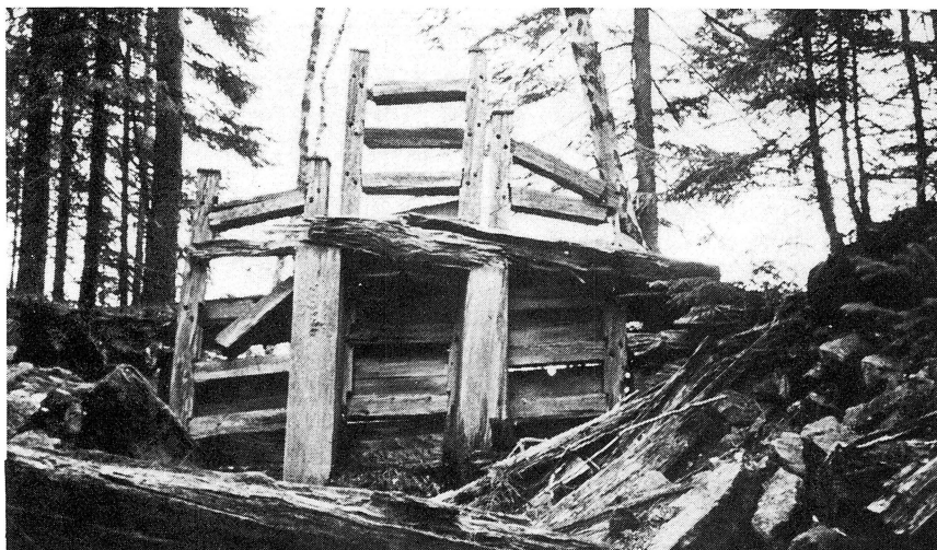
1993. Vad som återstår av dammen vid Dammtjärn