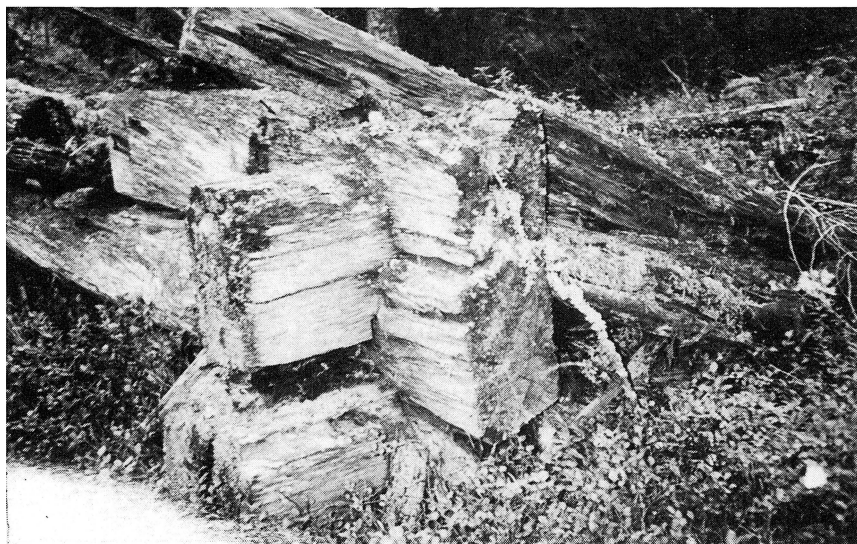
1993. Rester av bostad vid Dammtjärn