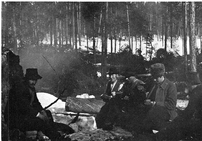
Skogshuggare under en matrast i skogen. Obs — personerna på bilden har inget samband med de i artikeln förekommande namnen.