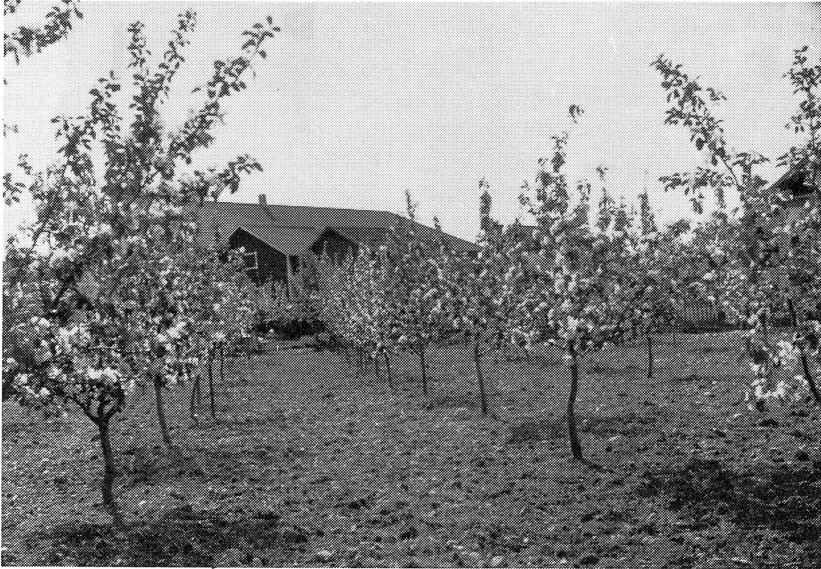
Korsnäsgårdens fruktträdgård på Sollerön.

”I ett nyligen utkommet nummer af denna tidning finnes införd en artikel med öfverskrift ”Ett tjufslägte”, hvilken är af sådan beskaffenhet, at vi ej kunna afhålla oss från att nedskrifva några reflexioner deröfver, helst ock densamma berör förhållandena i ’den lilla församlingen Sollerö’, som i anledning af sitt senaste ’prestval’ på visst sätt blifvit så uppmärksammas. Artikeln synes vara föranledd närmast af ’ett grundligt besök’ i prestboställets trädgård ’en obeckad natt mellan den 1 och 2 dennes’, ett besök som enligt insändaren upplyser, lemnat efter sig ’en hel förödelses styggelse’ — och sannerligen har man ej orsak att klaga för mindre än så! Huru vida ins:s jämmerliga klagovisor dock äro fullt befogade, derom torde blifva tu tal. Det säkra är emellertid, att han vid nedskrifvande af sin uppsats, varit ’öfvervåldigad af harm och bitterhet’, att vi må begagna hans egna ord, ty en argare bit kan man näppeligen påträffa än denna hans utgjutelse.’