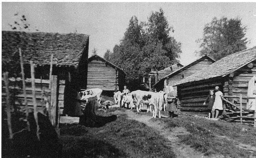
Från Rossbergs fäbod.