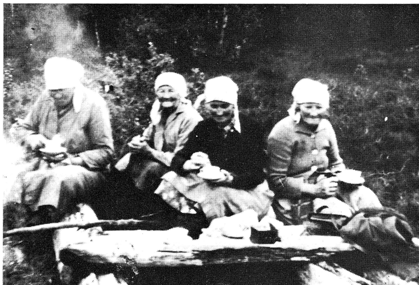
Rast på "sov-oln".