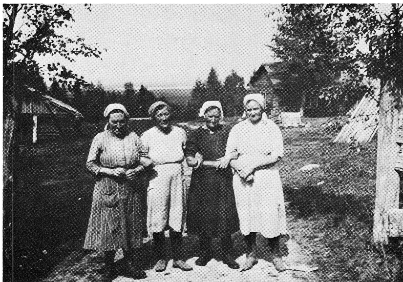
Lovbjers-keelingär a läsa.