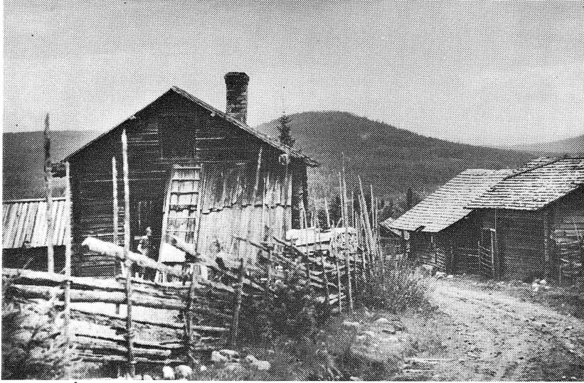
Lövberg. År 1916.