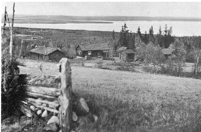
År 1930. Sollerö-Åsens fäbodalar. Lansergården.