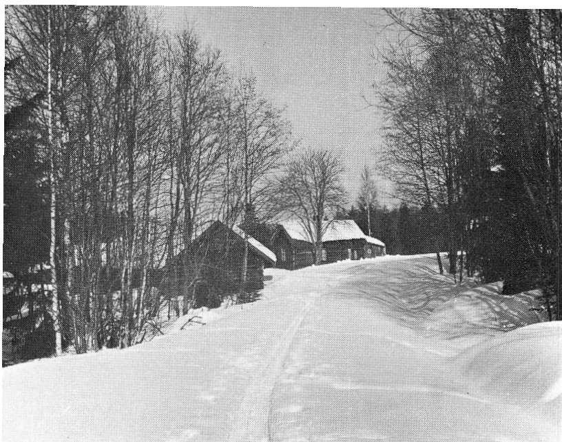
Lövberg i mierskrud.