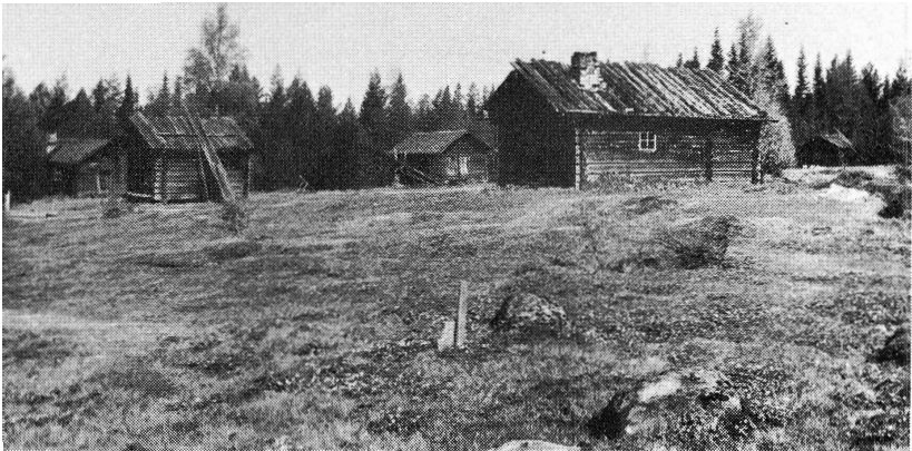
År 1917. Jmsi fædodar vid Jmsisjon, "lenderget). "rån tenna fædovail 'ar Skansens sidsu commit.