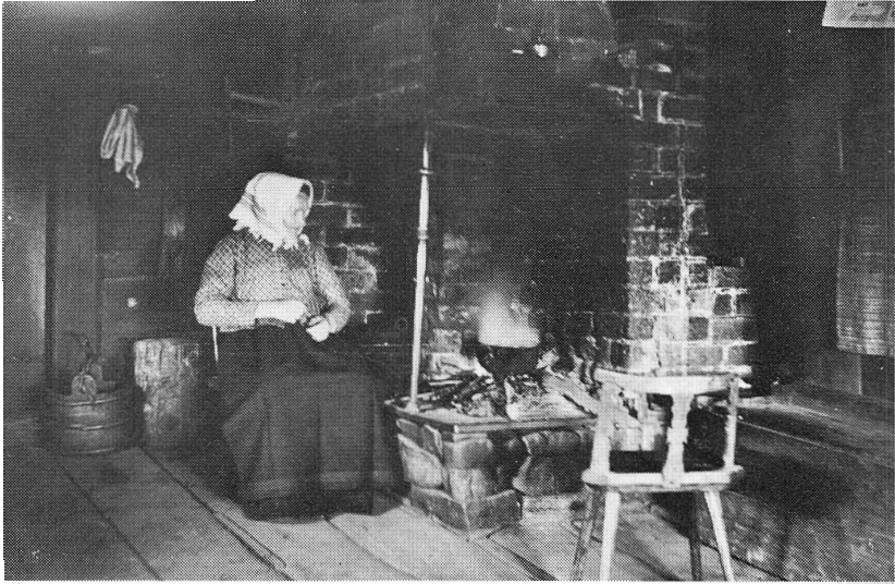
År 1917. Surjorsketling i Bjørka.