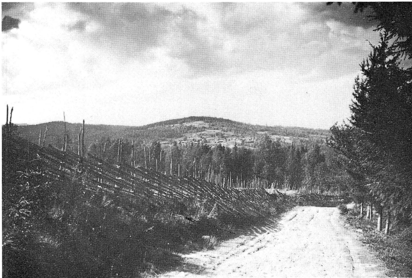
Gamla vägen i Åsen.