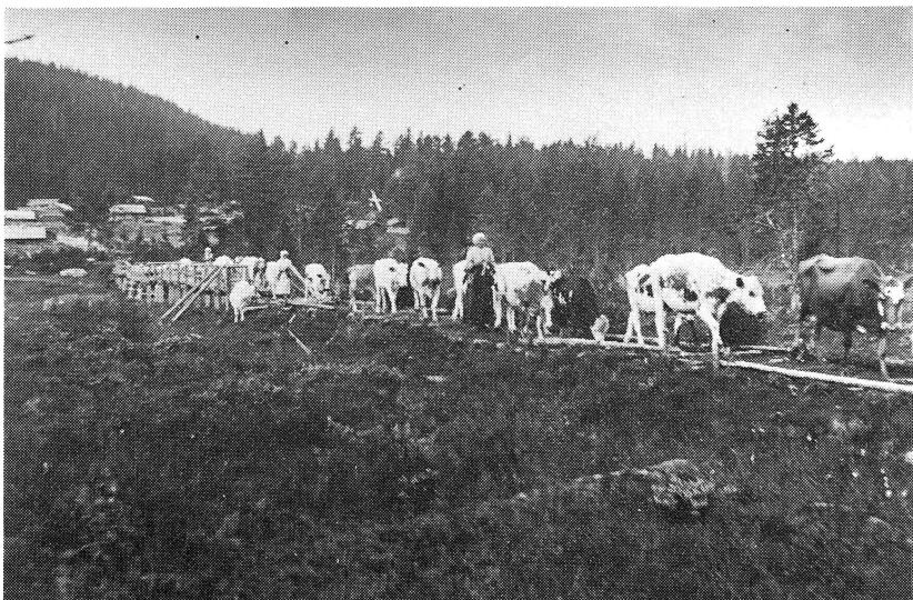
Buföring från Garberg.