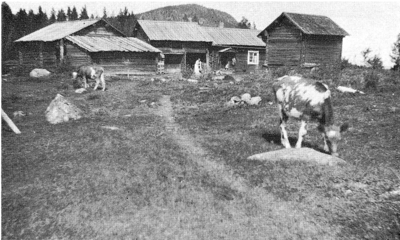
År 1919. Borrbergs fäbodan. Gesundaberget i bakgrunden.