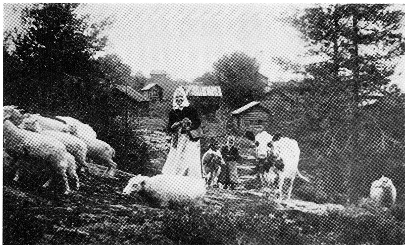
Nämkar Kari och Snis Mejt löser korna.