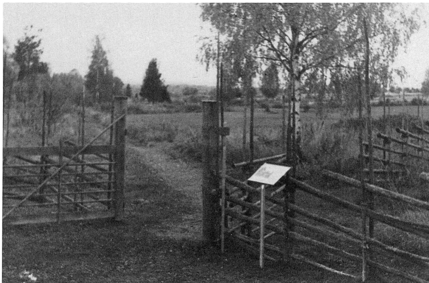
Promenaden startar vid Hembygdsgårdens nordvästra grind.

Vi passerar genom grinden vid den nordvästra delen av Hembygdsgården - den första informationen handlar om "Livet på vikingatiden" och vi ser ut över Bjärså kern - mot bergen och Siljan, Man ser på bilden och vi kan känna doften från djuren och från röken i hustakens öppning.