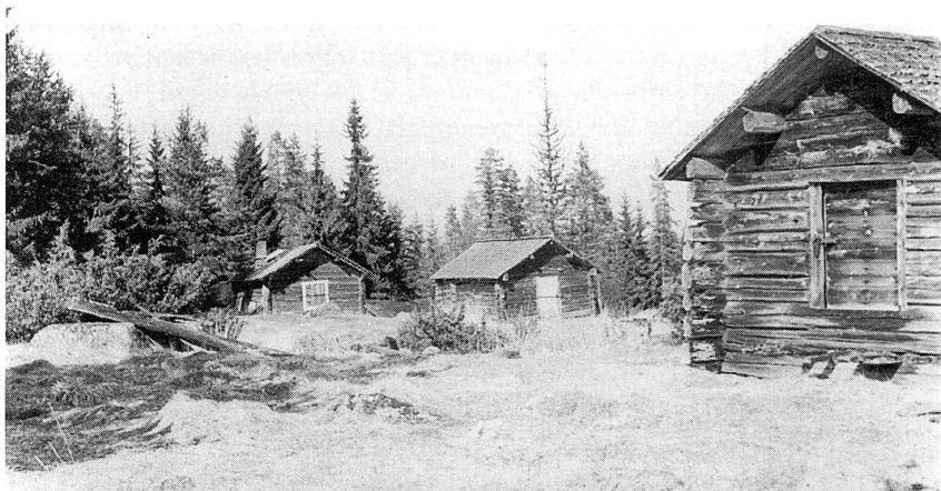
Nedre Garberg på senare tid. Flera stugor har skattat åt förgängelsen men man kan dock se den gräsbevuxna täkten.