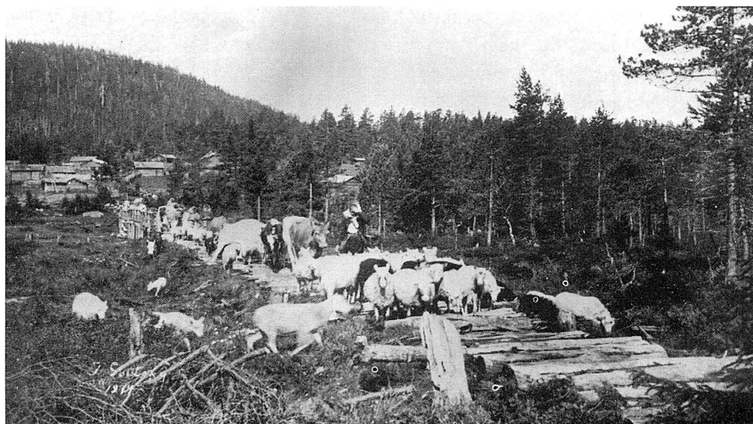
Buföringen hem från Nedre Garbergs fåbod 1911. "Buförslädet" med fåren först, passerar kavelbron. Bakom kommer korna och sista delen av buförslädet på träbron över Oradtjärnbäcken som har sitt utlopp i Grundmången.

Klockan tolv ser vi oss om efter en viloplats för nu ska vi sova middag. Någon går före till en liten kulle, tänder en liten eld och lägger mossa på. Då korna ser röken får de bråttom dit. De äldsta går först för de skall alltid stå närmast elden för att slippa myggen. Korna står där och idisslar, fnyser och sover sedan. De yngsta korna står utikring och fåren samlar sig i en flock i en utkant. Matsäcks-knytet tas fram och vi söker oss till en skyddad plats där vi inte blir trampade av djuren. Sedan äter vi vår matsäck och därefter lägger vi oss ner för att sova ett par timmar.