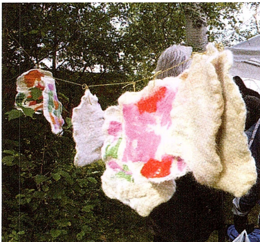
Tovade konstverk på tork.

Ett bra och starkt band är inte dumt att kunna göra i all hast. Eleverna fick lära sig den gamla metoden att slinga band. De får välja ut garn i olika färger, knyta fast dem vid rep som är uppspända mellan tallarna och sedan stå där tåligt i den nordliga vinden och slinga och fläta. Ska bandet vara tjockare, kan man samarbeta. Det är då det kallas slungning. Det tar lite tid att göra ett bra band: "Nu börjar det bli tråkigt, samma sak hela tiden". "Blunda, så blir det inte samma" .