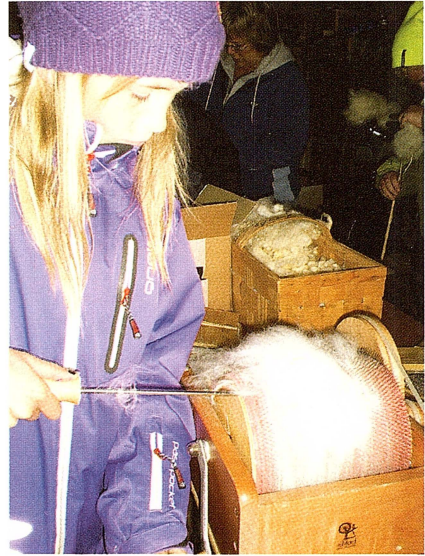
Försiktigt lossas den kardade ullen från kardmaskinens hjul, för att sedan föras vidare till sländan och bli garn.

När barnen kardat färdigt var det dags att spinna. Det äldsta sättet, med sländor, kunde alla prova på, men de fick även ta del av hur det är att spinna på det lite nyare sättet, med spinnrock.