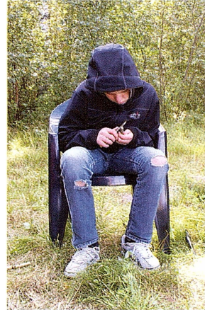
Djupt försjunken i täljningen.

I den friska höstluften var det ingen som kände för att bada, men heller ingen som klagade allt för mycket över kylan och blåsten.