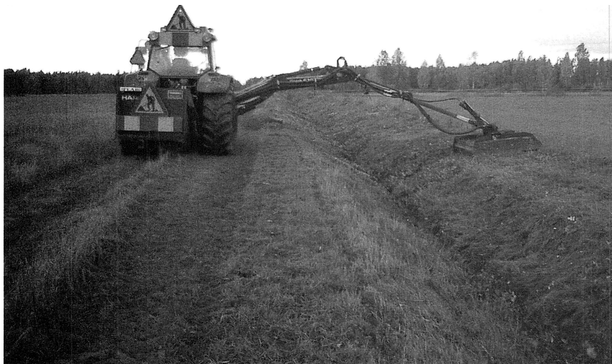
Hösten 2004 påbörjades ett försök att röja en del sträckor maskinellt.

Ungefär 8 km, främst i Rannmyren och Kulånisänget, röjdes manuellt men utan kostnad av bla arbetscentralen i Mora. Ett försök påbörjades 2004 med att efterröja maskinellt med ett sk dikesröjningsaggregat för att inte höga slyridåer ska växa upp igen. Den maskinella röjningen kommer att genomföras i Gemensamhetskogens regi med 2-3 år mellanrum under en tioårsperiod för att prova metoden.