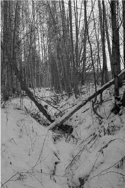
Underhållet av många diken är dåligt och funktionen försämrats.

Många delägare tog på sig grävningarbeten för att klara av att betala sin del av kostnaden. Instruktionerna för hur grävningen skulle utföras var utförliga. För att förhindra att diken rasade igen föreskrevs hur jordmassor och stenar skulle läggas