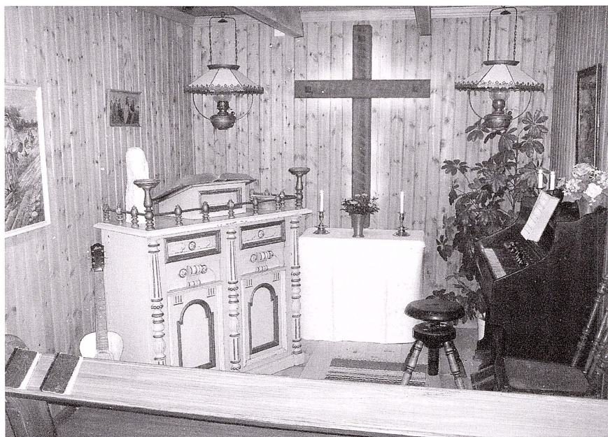
Det nya "gamla Missionshuset" vid Lafvasgårdens Samlarmuseum invigdes sommaren 2006.