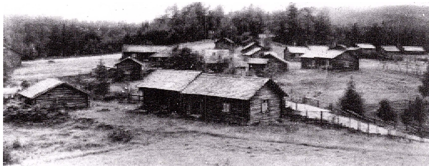
Rossbergs fäbod på 1930-talet.

I folktron hörde det till vanligheterna att pesten framställdes personifierad eftersom den inte tydligt kunde skönjas. På Sollerön fanns en sägen om "Pästiläntan", en skön dalkulla som strödde vackra saker kring sig, t.ex. smycken som ringar och halsband, för att locka unga karlar att dansa med henne. Den som lockades till att ta upp eller vidröra grannlåten eller dansa med den vackra flickan, dog inom kort i pest. Pästiläntan kom och sade "ska vi gå i ring och dansa med de små". De som dansade fick svarta fläckar i händerna.