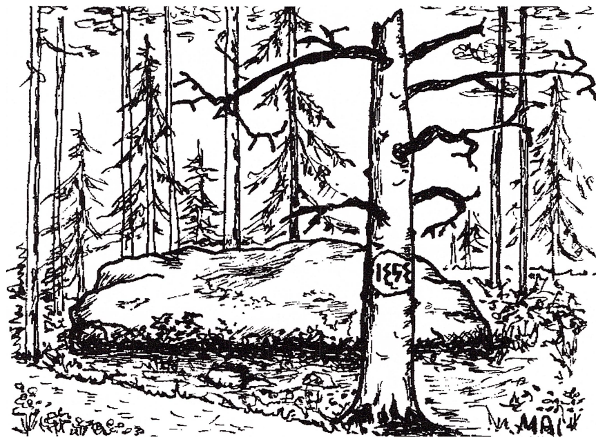
De i trädstammen inristade bakvända siffrorna ansågs skydda mot digerdödens smitta och andra onda makter.

Herdaminnet innehåller mycket sparsamma uppgifter om präster vid tiden för digerdöden. Sollerön nämnes inte alls och det är inte troligt att någon präst var tillsatt och boende på ön.