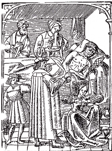
En läkare tillsammans med anhöriga vid en sjukbädd. Läkaren försöker skydda sig mot den sjukes stank och vidriga dunster genom att hålla för näsan. Ill. från en medeltida medicinsk handbok, Medicinska Muséet i Amsterdam.

Prästerskapet spelade en framträdande roll under digerdödens tid i sin funktion som rådgivare och religiösa handledare. Präster i gemen förespråkade upp-