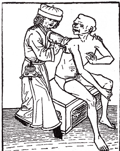
Vid en pestkur skär en läkare bort en böld vid armhålan för att minska pestens makt över patienten. Ill. från ett medeltida träsnitt. Stora Döden.

En allena rådande behandling var åderlåtning. Denna metod hade gamla anor och var en universalbehandling för allehanda sjukdomar och krämpor. Metoden