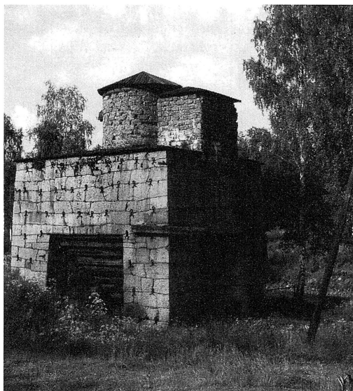
Masugnsruinen i Siljansfors i våra dagar.

Det fanns i äldre tider ett talesätt; ”Skogen ägdes av ingen - brukades av alla”. Det fanns vissa möjligheter att förtjäna någon riksdaler genom att leverera träkol till Siljansfors bruk och Limå bruk, som använde träkol i sina järnframställningsprocesser. Det skrevs en del kontrakt med bruken. Det var dock inte särskilt attraktivt att leverera kolen på de villkor som bruken erbjöd. Det finns uppgifter om att bruken betalade 1 riksdaler per skrinda levererat träkol jämte en del naturaförmåner som ”salt och dricka”, d.v.s brännvin. Det sista var tydligen viktigt. Siljansfors bruk hade upprepade konflikter med byamännen om kollevaranser på grund av svårigheter att få fram tillräcklig mängd. Det fanns sedan 1700-talet ett förbud att fälla timmerskog till kolning men runt Siljansfors var det tätt mellan kolbottnarna i skogen. Liknande förhållanden rådde vid Limå bruk.