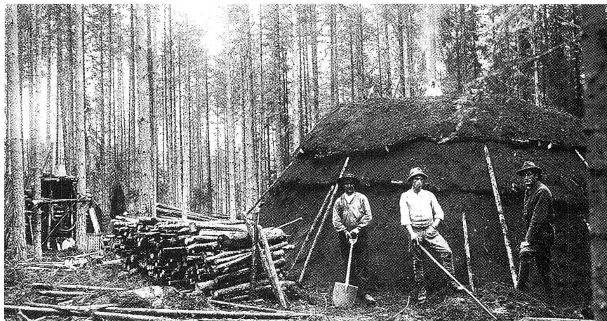
Kolmila i skogarna vid Siljansfors. Kolning krävde i de flesta fall insatser av ett helt arbetslag.