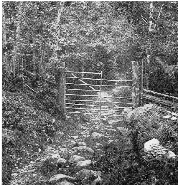
Flengrind "Porten till det förgångna".