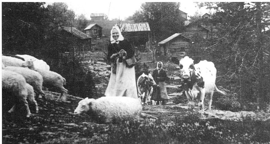
Kreaturen förs till skogsbete av ett par äldre okända "gäskaller" från Flenarnas fäbod. Som vanligt var de försedda med "slätjkupp" och strumpstickning. Fotograf var troligen Johan Öhman omkring 1915.

Av Solleröns tidigare omfattande fäbod-eller försörjningssystem finns i dag bara Södra Flenarnas fäbod kvar i relativt bevarat skick.