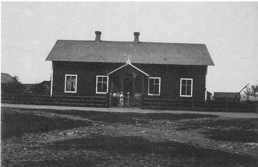
Almaskolan på 1890-talet, då relativt nybyggd. I bakgrunden skimtar byggnader från Ållasgården och Bölgården.