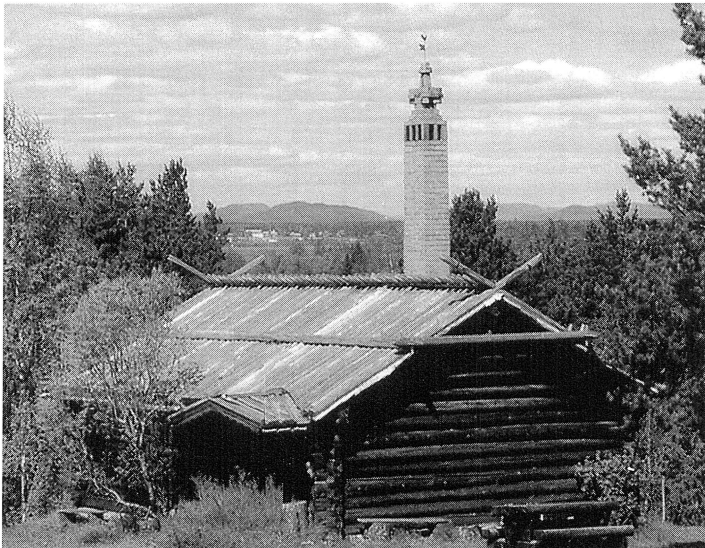
Typisk kronskorsten på stugorna på Sollerön, där "kronan" var murad med kors i fyra väderstreck. Lärkastugan i Bengtsarvet byggd 1925.

Draken som skyddssymbol återkommer på vikingabåten Biork, som sommartid utgör ett välbesökt utställningsobjekt på Hembygdsgården. Vikingatidens båtar var oftast utrustade med drakhuvuden i fören och som en pendang fanns en utsirad stjärt i aktern. Det lär ha funnits båtar där drakhuvudet var löstagbart och kunde alltså tas av vid färder som främst rörde fredlig handel och sedan monterats fast vid andra mera våldsamma utflykter. Draken skyddade alltså besättningen samtidigt som den kunde injaga fruktan hos motståndaren. Att draken skyddade människorna har alltså en historisk bakgrund med rötter ända från hednisk tid. På senare tid har draken framställts som en ond makt som rövat bort prinsessorna och som prinsarna måste döda för att rädda den sköna. Dessa berättelser hör dock hemma i sagornas värld.