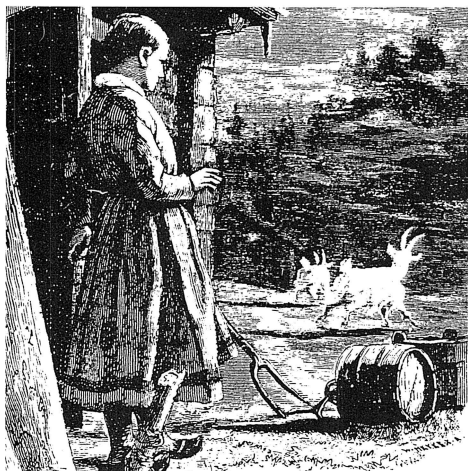
De vita rågetterna kunde visa sig ibland för vallkullorna på fåboden. Om de fick möjlighet att mjölka sådana getter, gav de mer mjölk än alla andra kreatur. Teckning: J. Tirén.

Man skulle spotta när man steg upp på morgonen för att dagen skulle bli god, när man tog i ett redskap eller företog sig ett och annat. Att spotta i nävarna förekommer än i dag men tidigare var det alltså inte enbart för att få bättre fäste i yx- eller hammarskaftet som man spottade. Numera är det fortfarande många som spottar när de möter en svart katt. Genom att spotta eliminerar man alltså oturen men inte många känner till varför man spottar. Det spottas även på metmasken för att ge god fiskelycka. En annan kvarleva från gamla tider är att förebygga oturen genom att säga: "peppar, peppar, ta i trä". Peppar men även salt ansågs av gammalt ha kraft och kunde avvärja det onda. Träet finns kvar efter det att kloka gubbar slog det onda ur en led med yxa över en huggkubbe samtidigt som han läste någon ramsa. Kraften i träet finns kvar efter denna sed.