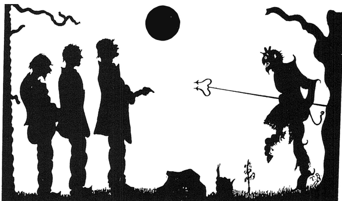
Besvärjelse mot djävulen med en ramsa, t.ex.: "kåss fötrull å vassera tri, dänn sjövänd". Teckning: Tore Brogård.

De äldres berättelser och varningar för fässkalln kan helt naturligt också haft en positiv effekt genom den avskräckande verkan de haft på barnen så att de inte lekte vid vattnet och riskerade att falla i.