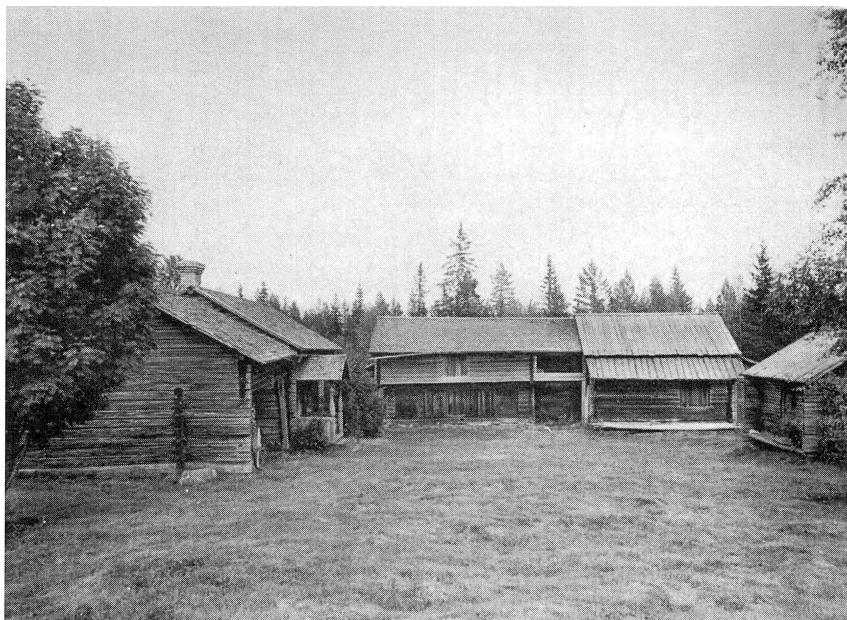
Krånggården på 1930-talet.