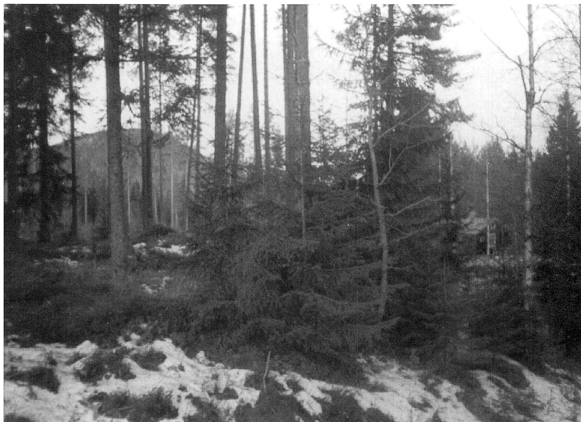
Skogen har erövrat det mesta av utrymmet på fäbodvallen. Här skymtar Sturullgården med Gesundaberget i bakgrunden.

Efter Lindgården fanns sedan ett åkerområde ("Grömindjen") på båda sidor om vägen, varefter Sturullgården återfanns på den västra sidan och Krånggården (sedermera Måsgården) på den östra.