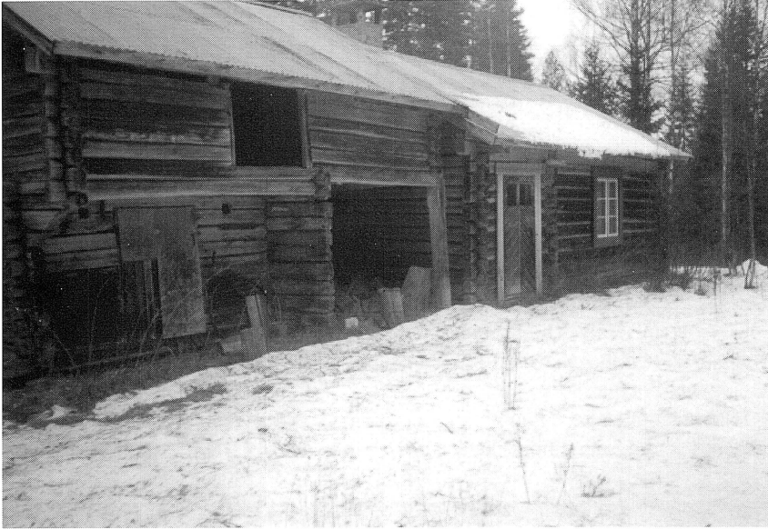
Grömingsgården i vinterskrud.