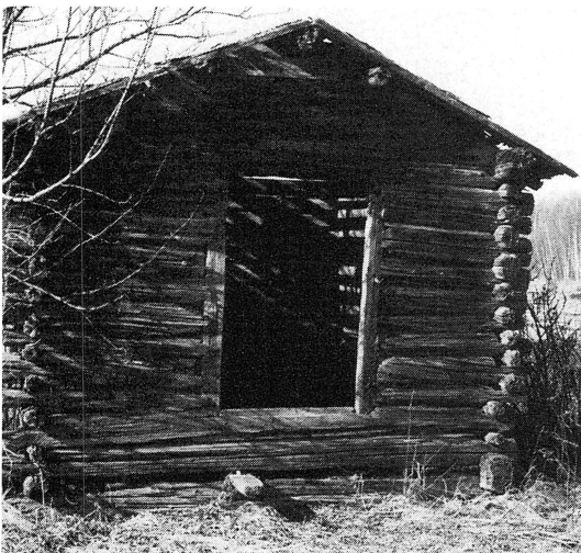
Ängsladan — silon, foderförvaring förr och nu.