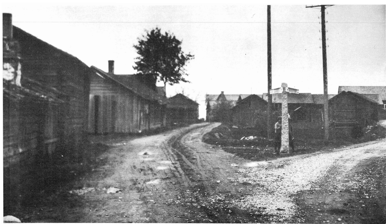
År 1926. Sollerön Vägskälet vid Gatukittan Vägen till vänster går till Utarnmyra Vägen till höger går till Bergtsarvet