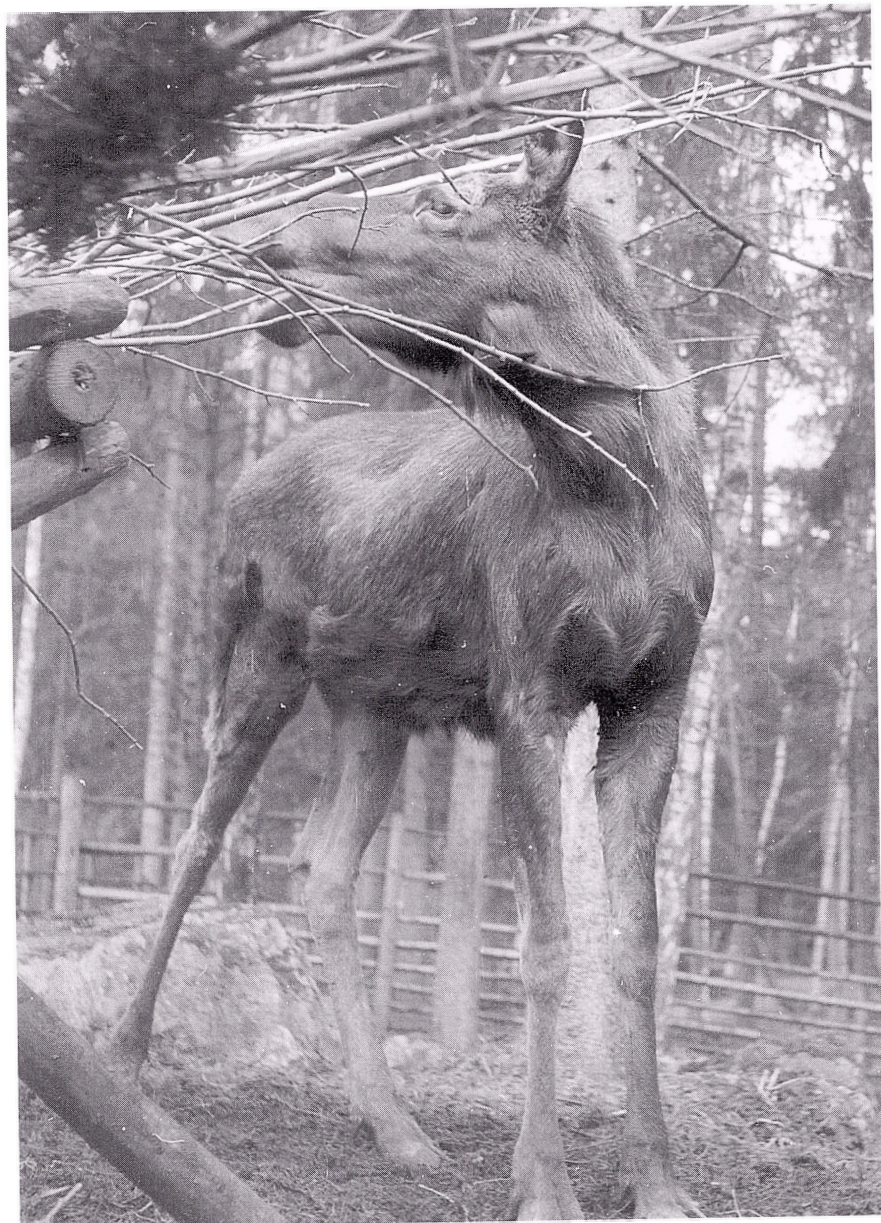
Alltid finns det något att bita i för en hungrig älggjölåring.