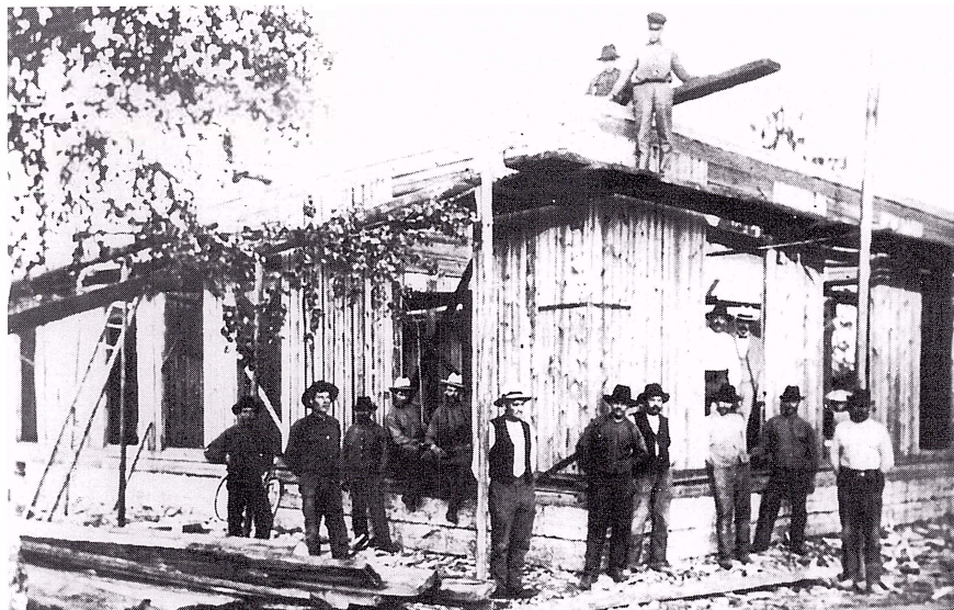
Arbetsstyrkan som byggde nuvarande Konsumfastigheten år 1909.