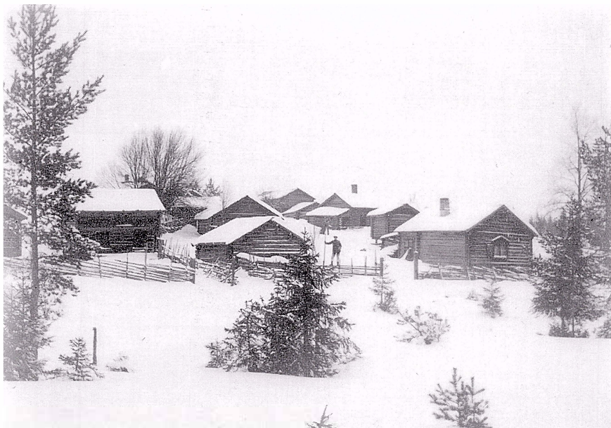
Flenarnas fäbod i vinterskrud. Bilden tagen från dammen och upp mot fäboden.