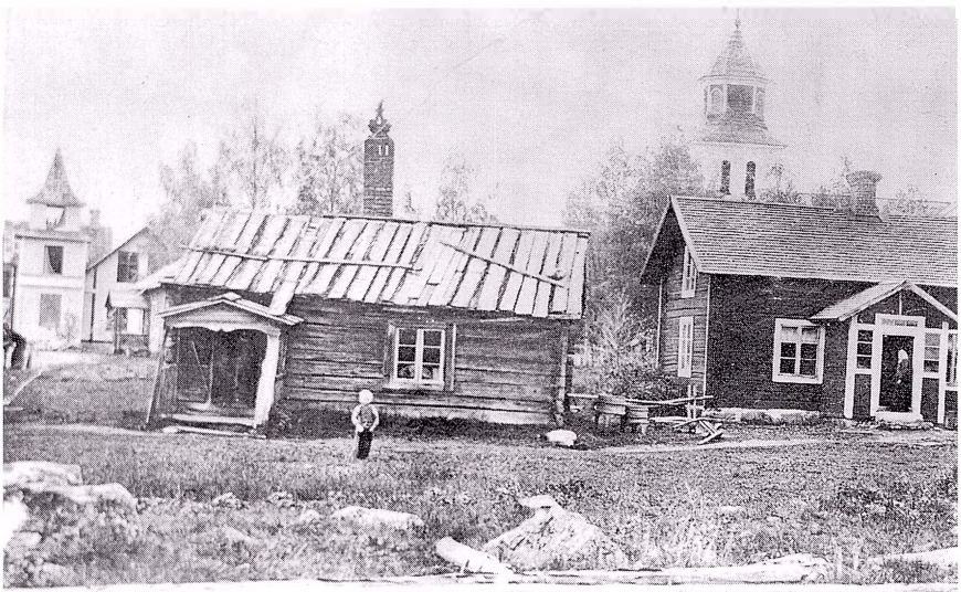
Samma gård fotograferad några år senare när det nya bostadshuset byggs. Till vänster i bakgrunden är Melinsgården med sitt typiska torn under uppförande.