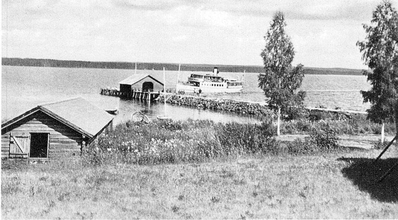
Båten kommer.

utverka tillstånd till kyrkobygget. Men det må vara honom förlåtet, därför att Solleröborna, genom hans insats, befriades från Moras prästerliga förmyndarskap.