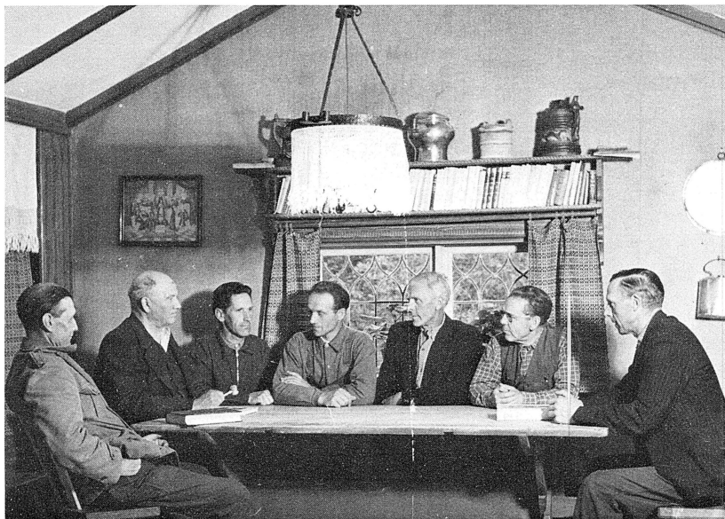
Bystämman på Örjangården 1945.

Vi som bor i Bengtsarvet måste känna ansvar för vår by och därför bildade vi förra året ett byalag. Detta byalag får ersätta bystämmor som tidigare i hundratals år hållits i Bengtsarvet, men som upphörde när kommunsammanslagningen var genomförd. En av dessa bystämmor hölls i Örjangården 1945, se foto. Meningen är att vi skall träffas några gånger om året och ta upp till diskussion vad som bör göras inom byn. Förra året ägnade vi några kvällar åt att snygga upp vid sjöstranden vid ångbåtsbryggan. Det är av stort värde om vi kan få till stånd ett aktivt byalag, där alla som bor i byn bör vara med. Vi har så mycket att värna om, inte bara vår vackra utsikt, utan vår gamla fina kultur och våra rika traditioner.