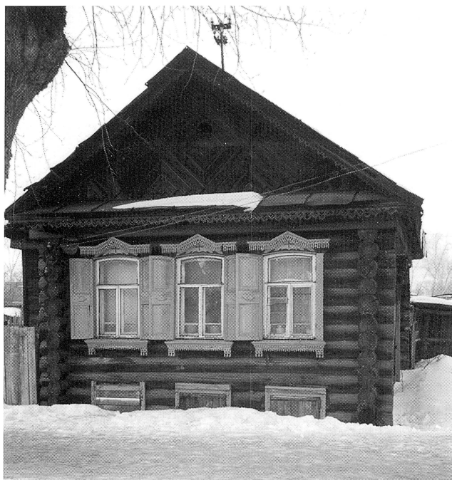
Typiskt ryskt bostadshus

Vi åkte in till centrum och gick in i olika affärer. Gick ett varv runt torget, där det var full ruljans på försäljningen. Vi köpte korv med bröd i en kiosk. Det smakade gudomligt. Det var tur att vi åt ute för till kvällsmat serverades sönderkokt potatis med lök och saltgurka. På kvällen tittade vi på barnen, som hade gymnastik- och dansövningar ledda av ett äldre barn.