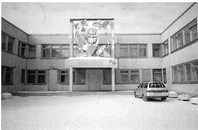
Barnhemmet i Jekaterinburg