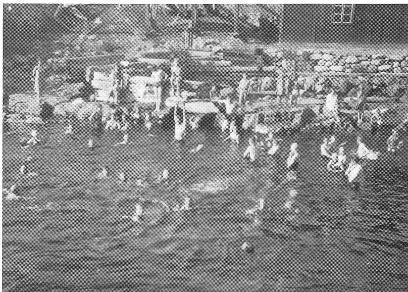
”Fällä”, omtyckt badplats i Ryssån vid sågen strax nedom stenbron.

och mej på sin rygg. Hon var varm och våt på ryggen. När hon gick över lilla gångbron och uppför branta backen, gällde det att klänga fast och det fanns bara manen att hålla i. När hon kom till staldörren, stannade hon så vi fick hänga om hennes hals och hasa ner till marken. Eftersom dörren stod öppen så kunde hon sedan gå in.