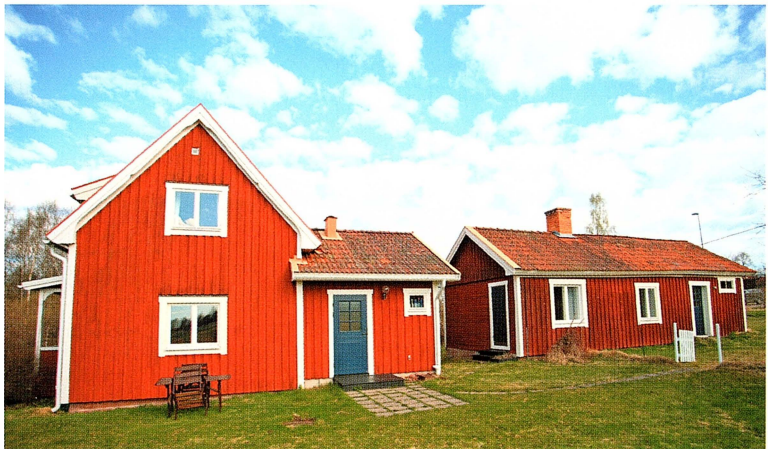
Bageriet i Gruddbo idag.