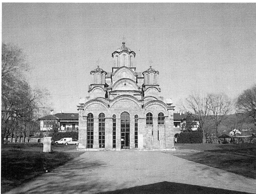
Klosterkyrkan i Gracanica.

På det hela taget fick KS 02, den andra kosovobataljonen, en lugn resa som det brukar heta. Ingen av våra soldater fick några allvarliga skador, och de få tillbud vi hade skedde under idrottsutövning, i trafiken, och under arbete i kök eller vid byggnation. Naturligtvis måste man vara medveten om att det alltid ligger en risk i ett uppdrag i fredens tjänst, och vid några tillfällen blossade det också upp kravaller som vår personal fick lösa upp. Oftast skedde detta under relativt ordnade former och resonemang med lokala ledare, men vid ett par tillfällen tvingades vi också använda vapenmakt – men då endast för att freda egen personal. Mitt bestående intryck är att den svenska modellen att arbeta med liten beväpning och nära folket i regionen gör ett stort intryck på människor. Både lokalbefolkningen och företrädare