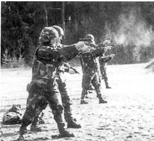
På skjutbanan.

Drygt två månader innan man reser ut till uppdragsområdet inkallas man till utbildning tillsammans med huvuddelen av den stab man är knuten till. Utbildningen genomförs vid SWEDINT i Södertälje, och ger både militära kunskaper och viktig information om situationen i det område man ska arbeta. Inför arbetet i Kosovo fick vi alltså lyssna till föredrag och se filmer och bilder från landet. Men utbildningen innehöll också mycket annat som är nödvändigt inför ett uppdrag av den här typen. Etik, sjukvårdsövningar, vapenträning med AK 5 och pistol (Glock 9 mm), körträning i terräng och på väg med MB Geländewagen och mycket annat ingick.