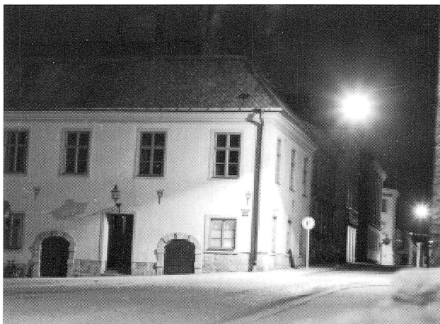
Ibland följde kameran med på nattliga patrullrundor. Här vilar lugn över polisstationen

Den tidens polisstation var inhyst i Rådhusets övre del invid Stora torget och med Kristine kyrka som närmaste granne. En ny erfarenhet var nattpassen. Man hade att i två timmar spankulera på stadens gator. Dessbättre var de oftast stilla och tysta. Visaren på tornuret i kyrkan segade sig sakta fram medan man väntade på att passet skulle sluta. Att sova inne på polisstationen var inte tillåtet. Någon timmes vila kunde man få om det var lugnt. Efter nattpasset gällde det att försöka sova litet mitt på dagen för att sedan gå på kvällspasset kl. 17. Skiftgången för-ryckte dygnsrytmen och det tog en tid innan man anpassade sig. Kroppen var inte inställd på att arbeta och sova i dessa intervaller. Så småningom lärde man sig att skriva rapporter för olika förseelser som medborgarna gjorde sig skyldiga till, mest fylleri och smärre trafiksynder.