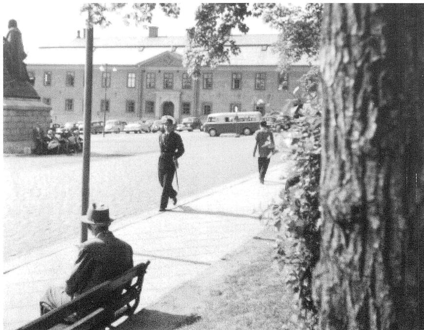
Patrullerande polis vid Stora Torget. Rådhuset med polisstationen i bakgrunden.

ordningspolisen, dels kriminalpolisen samt statspolisen i två veckor, uppdelat på ordnings- och kriminalpolis. Man fick alltså gå civil och se hur de andra arbetade och därmed få en första inblick i de kommande göromålen. Det var den enda utbildning som förekom. Troligen rapporterade befälen sina intryck om mig till landsfogden. Efter några veckor fick jag en vink om att det var dags att uppsöka stadens skräddare och ta mått på en uniform.