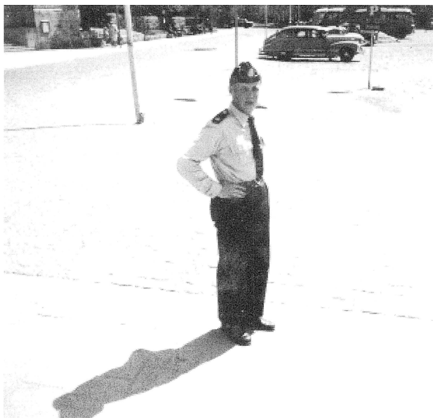
Nya sommaruniformen (m.-54) luftas vid Stora Torget.

Mina närmaste chefer var de fyra överkonstaplarna. Skiftgången gjorde att man träffade dem olika dagar. De var fyra skilda personligheter och även bland polis-konstaplarna fanns det sådana som man fick en direkt och god kontakt med. Det fanns även de som höll sig på sin kant och var svårare att komma till tals med. Bland aspiranterna rådde en god anda och vi umgicks även på fritiden. Helhetsintrycket var dock att i kåren rådde god kamratskap. Ett visst idrottsintresse fanns och Falupolisen deltog i bl.a. korpfboll med växlande framgång.