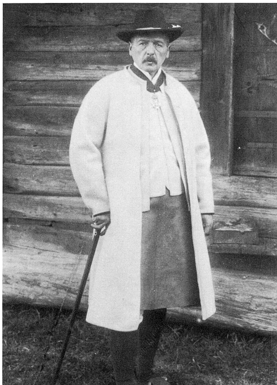
Anders Zorn

Denna tid var de stora eldsjälarnas tid. Uno Stadius kallade sig för övrigt för "tändstickan". Utöver dem som redan nämnts fanns där Arthur Hazelius, Gustaf Ankarcrona och Karl Erik Forsslund, som alla präglade tiden och angav en målinriktning, som kom att bli bestående i bl a Nordiska Muséet och Brunnsviks Folkhögskola men som även gav "ringar på vattnet-effekter" landet över i form av insamlingsverksamhet och hembygdsväckelse. Det var en tid då entusiasterna ledde folket och folket log, åtminstone ganska många.