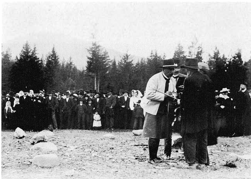
Zorn i samtal med spelmän vid spelmansstämman på Måståpan i Gesunda 1906.

Vad gjorde Zorn för kulturen? Jo, han understödde all folkbildande verksamhet, inte minst förmedlad genom föreläsningsföreningen, han såg till att folk använde sockendräkten och att majstänger restes på nytt.