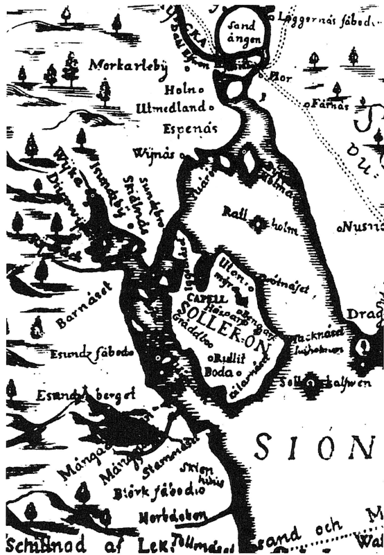
Jacob Torstlunds karta från år 1729 visar Solleroön och en del av byindelningen och topografin överensstämmer bra med nutida kartmaterial.

redovisas byn Rannemyrgatan med 12 - 16 hushåll. Namnet finns sedan inte alls i längderna och har tydligen upptagits i Bodarna. Under 1600-talet försvann även byarna Vickelsbyn till Utanmyra och Småjönsbo till Bodarna.