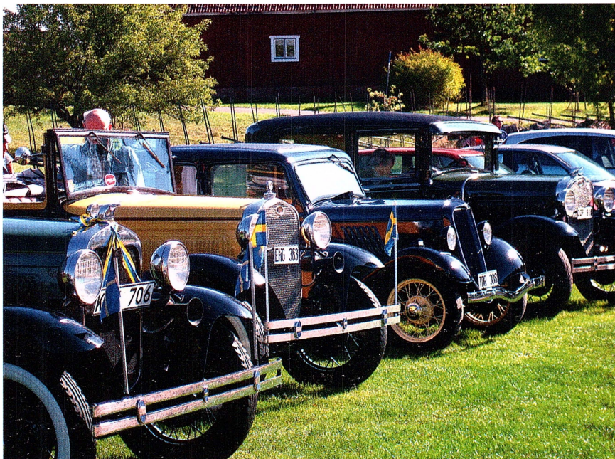
Delar av startfältet.

2010 var intresset betydligt sämre än tidigare år, mycket beroende på det kalla och regniga vädret som varit veckorna före. Det var endast 20 startande som dock var mycket nöjda och lovade att försöka få med dubbelt så många till nästa år. Det var gott om plats på dansgolvet i föreningslokalen det året och mycket mat