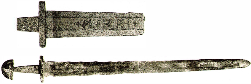
Svärd grav 9, delförstoring av svärdet med dess inskrift Ulfberhts.

Ett märkligt föremål från grav 1 är en liten gjuten hängamulett. Den föreställer ett mansansikte och ett stort skägg. Snodden går genom huvudet. Kanske är det en gud som avbildas? Kanske är det guden Tor som var böndernas gud?