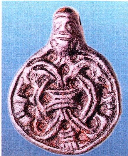
Amulett från grav 1.